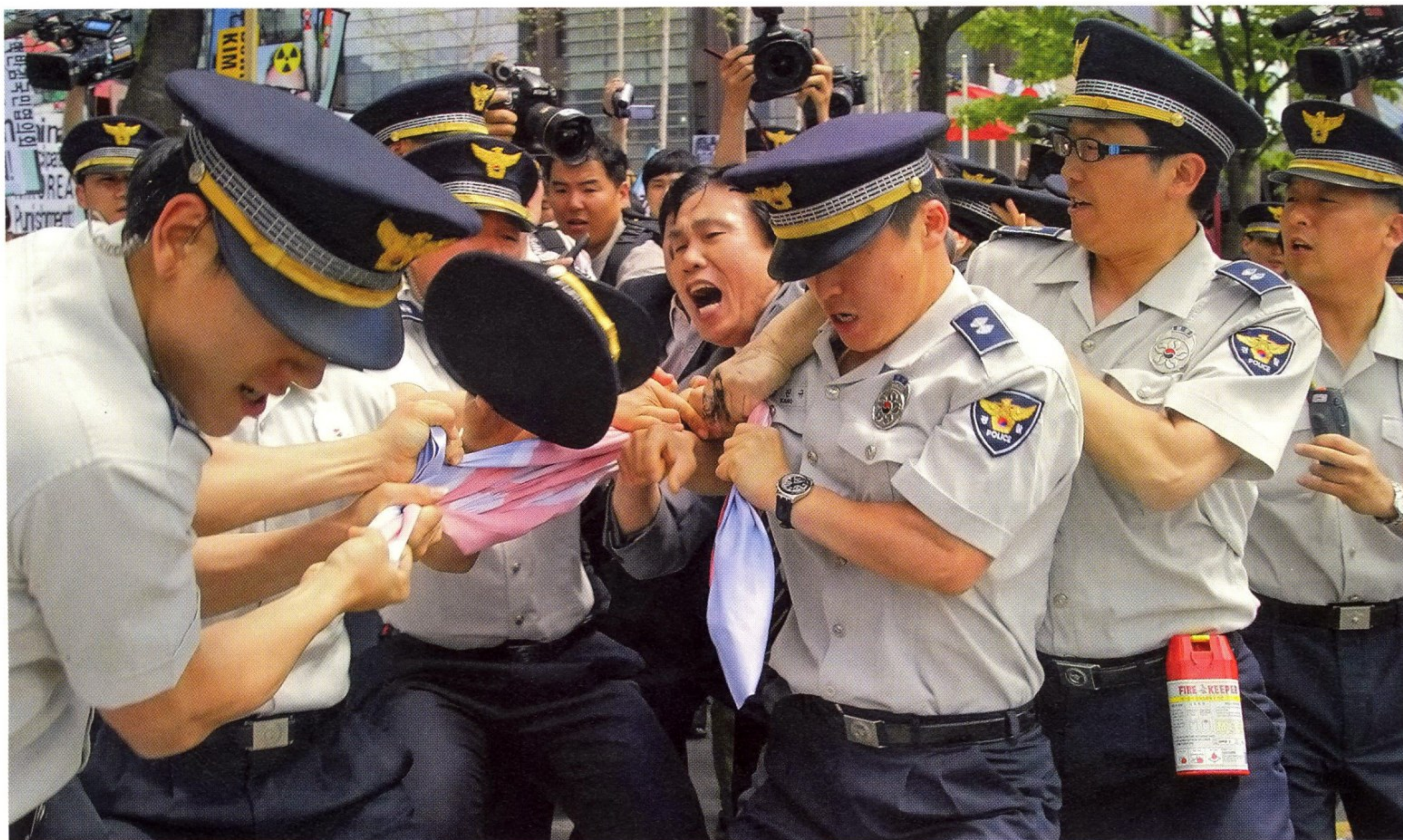
КОРЕЙСКАЯ ПОЛИЦИЯ ПРОТИВОСТОИТ ДЕМОНСТРАНТАМ, НАМЕРЕВАВШИМСЯ СЖЕЧЬ ФЛАГ КНДР (МАЙ 2010 ГОДА)

Командует силами правопорядка генеральный комиссар полиции, а в его отсутствие — заместитель генерального комиссара.