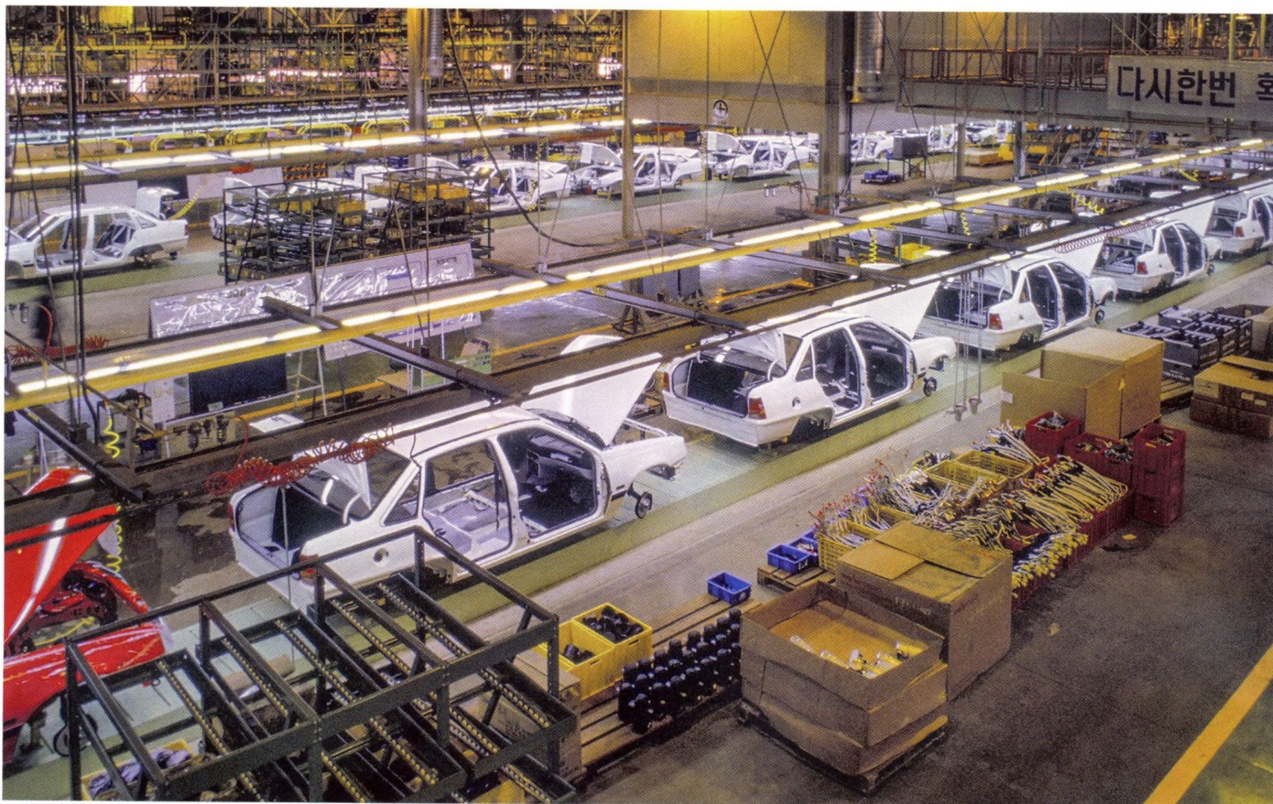
ЛИНИЯ ПО СБОРКЕ АВТОМОБИЛЕЙ НА ЗАВОДЕ DAEWOO В ЮЖНОЙ КОРЕЕ

не уедешь, поэтому в начале 90-х годов было решено, что следующее поколение автомобилей Daewoo будет разрабатываться, что называется, «с нуля».