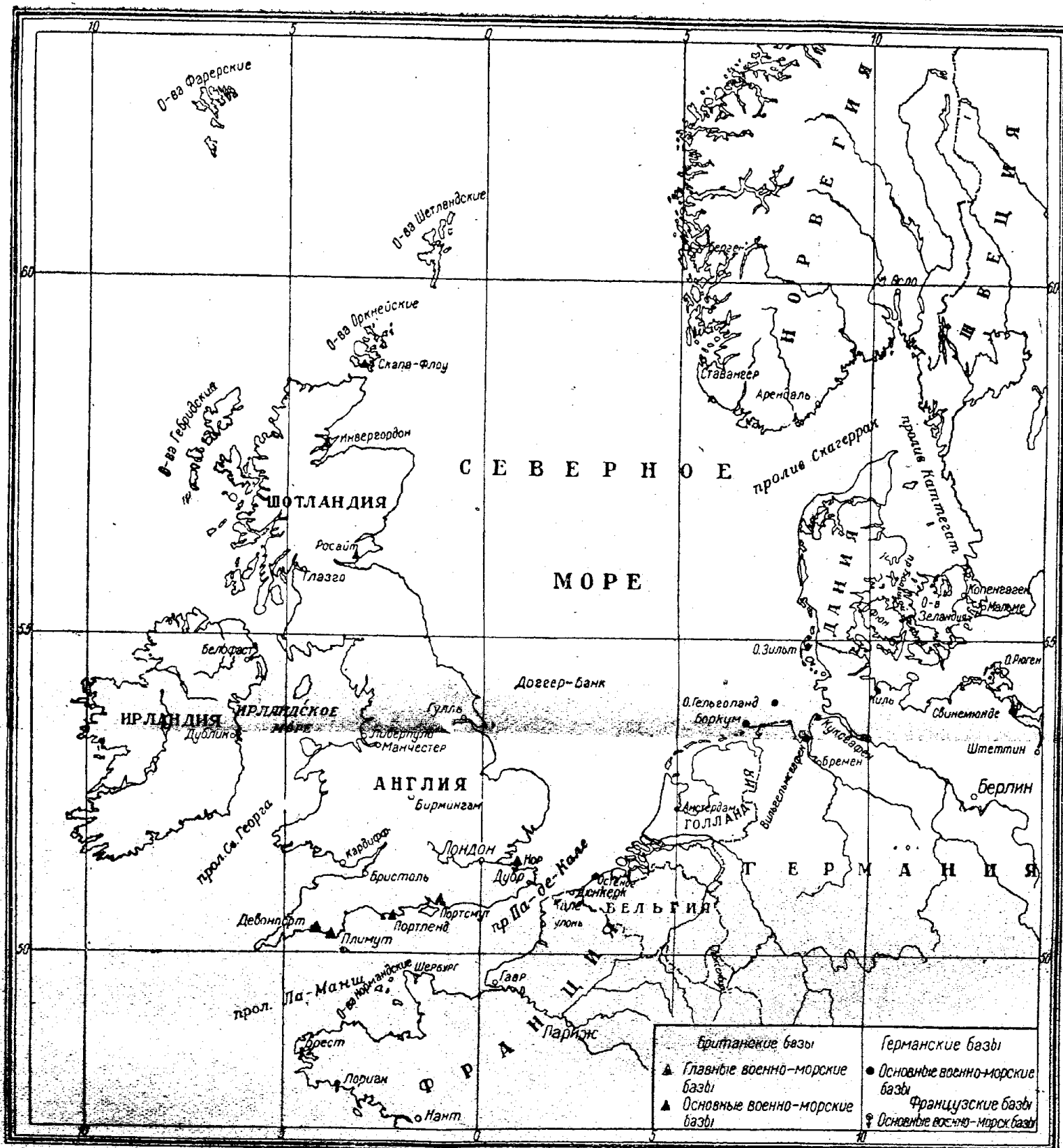
Схематическая карта Северного моря.