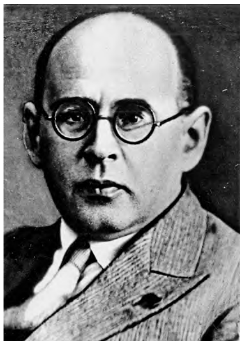
Николай Николаевич Крестинский. 1930-е годы.

важная советская должность за границей. Николай Николаевич, как и Литвинов, говорил на нескольких языках и был прагматиком. Ему подходила работа со средним классом, социал-демократами и прусскими консерваторами Веймарской Германии. Крестинский понимал, как себя вести с немецкой элитой.