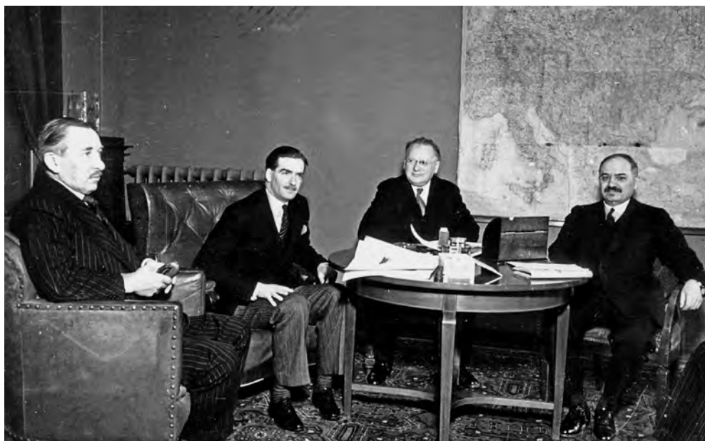
Встреча британского лорда-хранителя печати Э. Идена с М. М. Литвиновым в Москве. Слева направо: лорд Чилстон, Э. Иден, М. М. Литвинов, И. М. Майский. 28 марта 1935 года.

лает. Иден отвечал уклончиво 1 . В этом и была проблема: программа Литвинова на этих переговорах предполагала далеко идущие планы, но Иден сводил их на нет своими увертками. СССР был готов к решительному антигерманскому походу, британцы — не особо. Альфан оценил встречи как успешные, а Чилстон выразил беспокойство, что Литвинов переоценивает влияние Идена в Лондоне. Чилстон отметил, что нарком играл по-крупному. И мог бы отметить — по большим ставкам: если бы что-то пошло не так, он лишился бы поста 2 . Литвинов проводил Идена на вокзал и напутствовал его словами «ваш успех — наш успех» 3 . У Идена были на сей счет сомнения; у Ванситтарта, когда он ознакомился с иденскими записями бесед, они тоже вполне могли возникнуть. В своем отношении к нацистской