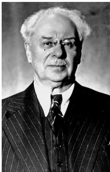
Владимир Петрович Потемкин. 1930-е годы.

в тюрьму. Потемкин окончил университет в 1900 году и начал преподавать историю в гимназии, но в то же время снова начал заниматься революционной деятельностью в Московском комитете РСДРП. После Октябрьской революции он работал в Народном комиссариате просвещения. В 1919 году Потемкин вступил в РКП (б) и сражался на стороне большевиков во время Гражданской войны. В 1922 году он поступил на дипломатическую службу. Владимир Петрович был хорошим дипломатом и умел ладить с иностранными коллегами.