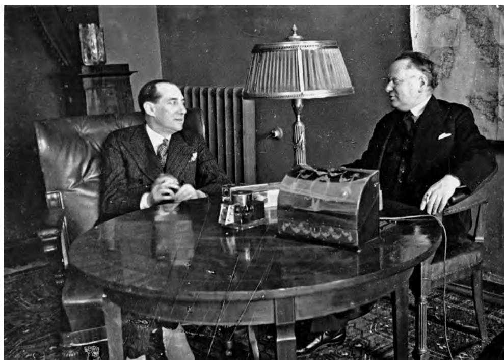
Встреча наркома иностранных дел СССР М. М. Литвинова (справа) и польского министра иностранных дел Ю. Бека в Москве. 13 февраля 1934 года.