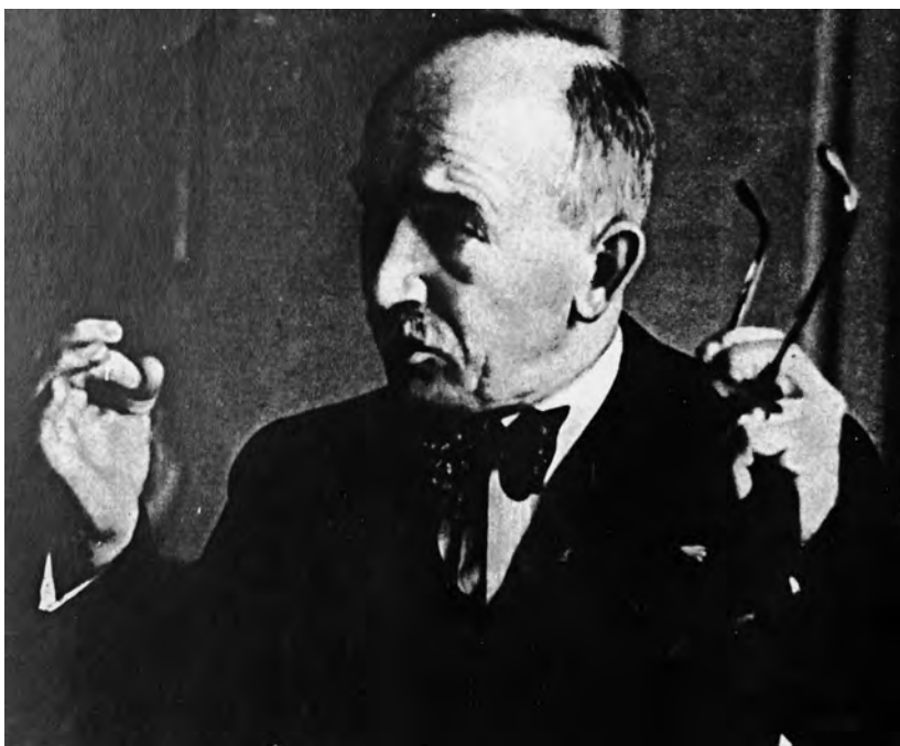
Президент Чехословакии Э. Бенеш

3 мая, когда стало известно о подписании франко-советского пакта, Бенеш отправился к Александровскому обсудить возможность заключения соглашения по образцу франко-советского 1 . В общих чертах он уже обозначил свою позицию в Женеве в разговорах с Массильи и Литвиновым. Бенеш просил о двух дополнениях к французскому тексту: 1) Чехословакия должна быть освобождена от обязательств прийти на помощь СССР в случае советско-польской войны; 2) действие пакта должно быть в рамках Локарнских соглашений 1925 года. Литвинов советовал Сталину согласиться на этот вариант: французы уже выразили одобрение, поэтому отказать на этом этапе будет сложно. По словам Литвинова, он уже уведомил Бенеша о том, что два договора не могут быть идентичными, так как Чехословакия не подписывала Локарнские соглашения. Повторяя сказанное Литвинову в Женеве, Бенеш сообщил Александровскому, что «Чехословакия может оказывать помощь лишь в тех случаях, когда таковая будет оказываться