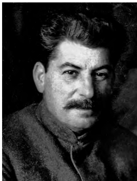
Иосиф Виссарионович Сталин. 1932 год

рину на глазах у их единственного выжившего сына. Пара в итоге разошлась. Как писал один из ранних биографов Сталина, покойный Исаак Дойчер, у отца были и хорошие стороны. Виссарион и Екатерина отправили сына учиться в церковную школу. Как и большинство отцов, он хотел, чтобы его сын жил лучше, чем он сам. Виссарион умер в 1890 году. Иосиф Виссарионович в возрасте 15 лет получил стипендию на обучение в семинарии в Ти-