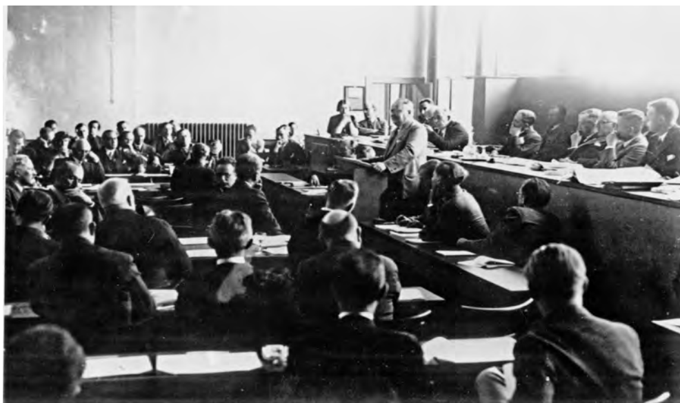
М. М. Литвинов произносит речь в Женеве по случаю вступления СССР в Лигу Наций. 1934 год.

США и СССР, поскольку оно было крайне важно для поддержания мира на Дальнем Востоке, (второе) то, что в настоящий момент еще важнее организовать защиту тыла СССР на случай нападения Японии, добиться понимания с Францией и установить дружеские отношения с Англией, (третье) то, что на настоящий момент нельзя делать ничего такого, что могло бы разозлить Францию и Англию» 1 .