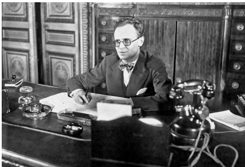
Французский министр авиации П. Кот. 1933 год

коллегами, что помогало улучшать отношения между Францией и СССР. Учитывая его обязанности, он был тесно связан с Министерством обороны и «Компани франсез де петроль», а в особенности с полковником Жаном де Латром де Тассиньи и вице-президентом компании Робером Кейролем.