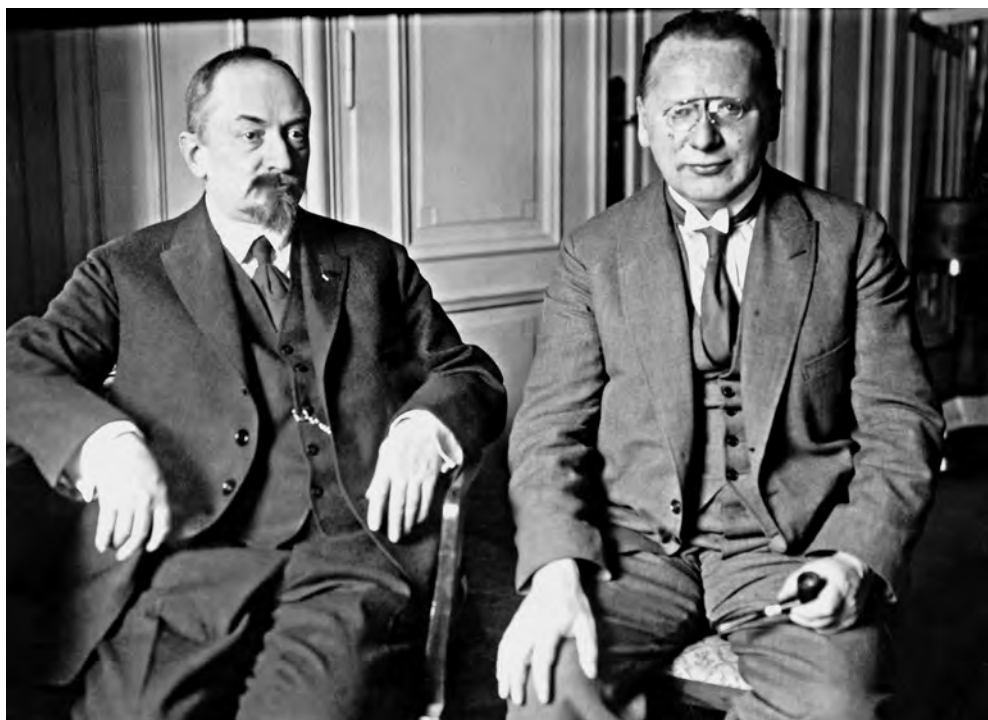
Георгий Васильевич Чичерин и Максим Максимович Литвинов. 10 апреля 1922 года, Генуя.

В 1920-х годах внешней политикой СССР занимался нарком иностранных дел Георгий Васильевич Чичерин и его первый заместитель — замнаркома Литвинов.