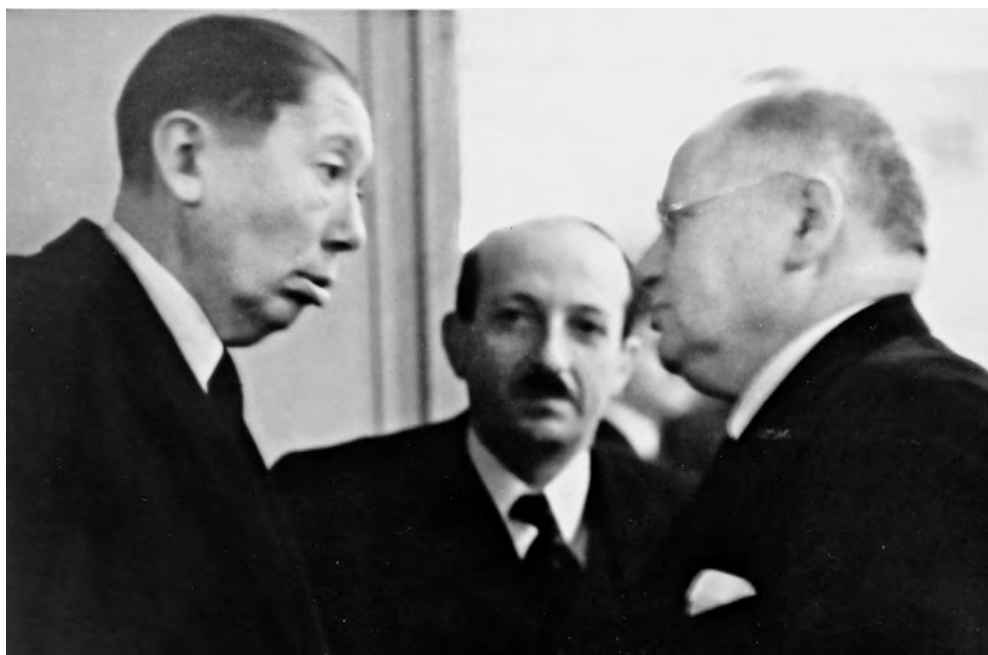
Встреча в Женеве наркома иностранных дел СССР М. М. Литвинова с министром иностранных дел Румынии Н. Титулеску.