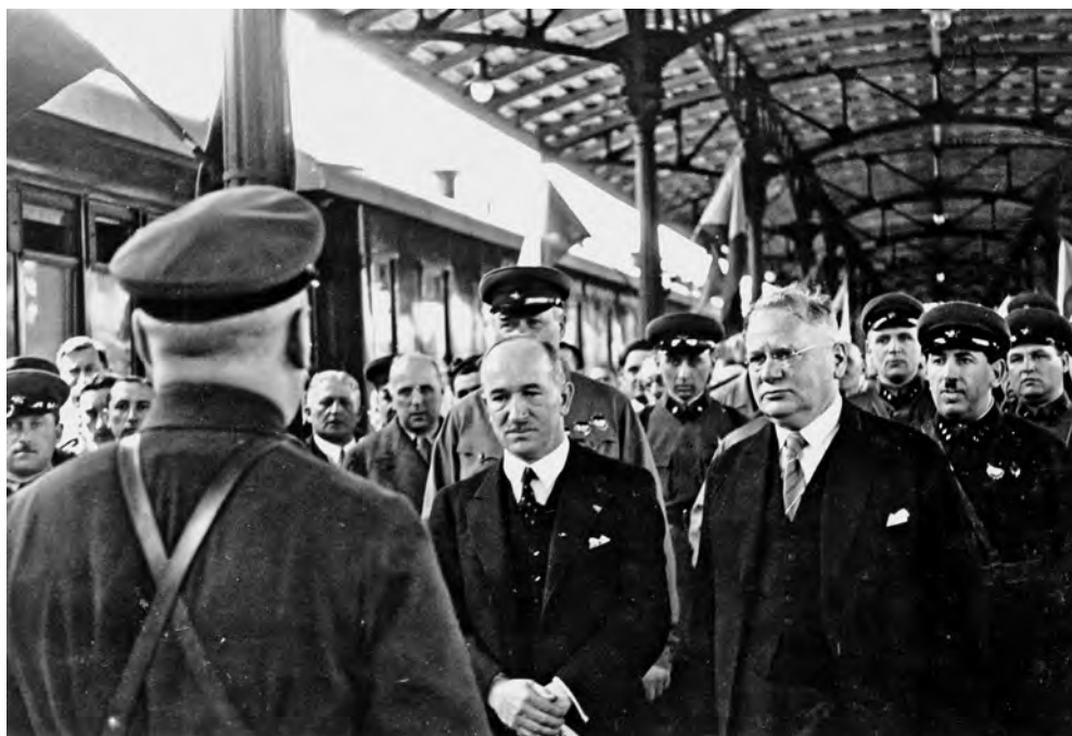
Нарком иностранных дел СССР М. М. Литвинов (справа) встречает президента Чехословакии Э. Бенеша. 8 июня 1935 года

Читатели помнят, как работник французского МИД Рене Массильи хвастался тем, как они «бойкотируют» советские предложения. Французы были готовы лишь к временному соглашению с СССР, чтобы оставить двери открытыми для Берлина. Французский Генштаб выступал против расширения пакта: у Франции уже были соглашения с союзниками, и не было никаких особых причин для заключения еще одного с СССР. Это было интересное заявление для страны, которая отчаянно нуждалась в сильных союзниках, но Генштаб не хотел, чтобы появился повод у Германии для повторной оккупации демилитаризованной Рейнской области или у Польши для заключения союза с Гитлером, чтобы защититься от «русской угрозы» 1 .