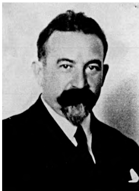
Полпред СССР в Германии Я. З. Суриц. Середина 1930-х годов

посол не говорил, так это того, что Политбюро, а по сути Сталин, решили сыграть в азартную игру и сделали ставку на Францию, но по объективным оценкам шансы на успех были крайне малы.