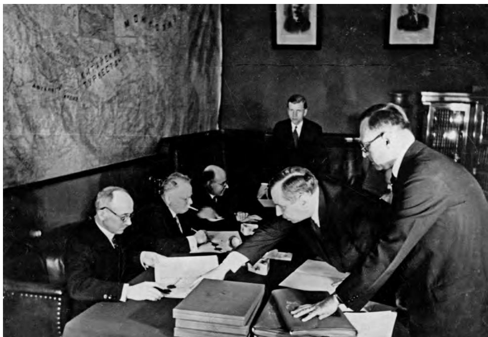
Нарком иностранных дел СССР М. М. Литвинов и президент Чехословакии Э. Бенеш обмениваются ратификационными грамотами в Москве. Слева от Литвинова Н. Н. Крестинский. 8 июня 1935 года.

Были ли у СССР вообще надежные союзники в середине 1935 года? Да, была Чехословакия. Бенеш и Александровский подписали пакт о взаимопомощи 16 мая 1935 года, и Бенеш приехал в Москву через несколько недель, чтобы подписать ратификационные документы.