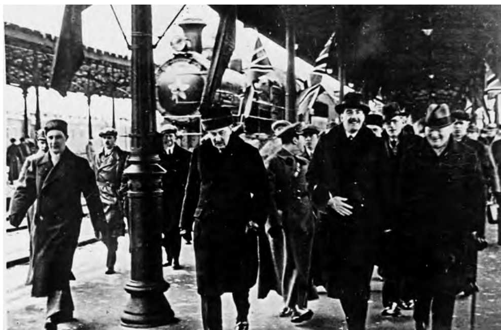
Прибытие британского лорда-хранителя печати Э. Идена в Москву (справа от него лорд Чилстон, слева М. М. Литвинов). 28 марта 1935 года.

Литвинов говорил, что у СССР нет ни тени сомнения в агрессивных намерениях Германии. Германская внешняя политика основана на двух основных идеях — реванша и доминирования в Европе. Для воплощения своих планов Гитлеру нужно было посеять раздор между СССР и Англией, и он, по мнению Литвинова, полагал, что весь мир настолько ненавидит СССР, что простит Германии любую авантюру. Пока рано было говорить о том, куда именно Гитлер нанесет удар в первую очередь, но удар несомненно будет нанесен. Литвинов полагал, что Германия не забыла уроков истории, из которых следует, что попытки завоевать Россию оборачивались для завоевателя значительными потерями и невозможностью удержать территорию.