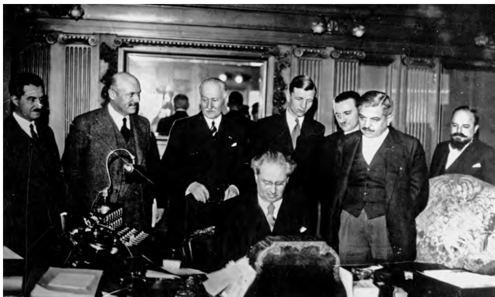
Советский полпред В. П. Потемкин в Париже подписывает франко-советский пакт в присутствии министра иностранных дел Франции П. Лаваля и официальных лиц, 2 мая 1935 года.

зов слишком резко подчеркивать отсутствие обязательств автоматической помощи. Но это уже теперь дело прошлое».