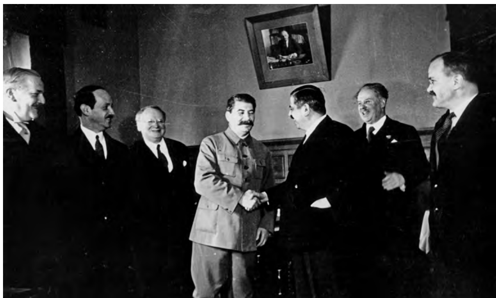
Встреча на высшем уровне в Москве премьер-министра Франции П. Лаваля с главой СССР И. В. Сталиным (слева направо: Ш. Альфан, А. Леже, М. М. Литвинов, В. П. Потемкин и В. М. Молотов). Май 1935 года.

советское военное сотрудничество. Французское верховное командование не было информировано о дискуссиях, которые вел Лаваль в Москве, но держало дверь открытой, ожидая лишь отмашки Лаваля к началу переговоров. Лаваль, как это за ним водилось, по возвращению в Париж отложил начало военных переговоров 1 . Сталин согласился на совместное коммюнике с абзацем в поддержку французской национальной обороны 2 . Это вызвало ужас у опального Троцкого. Но почему бы и не поддержать французскую национальную оборону, если на кону организация антинацистского альянса? Сталин видел в этом цель, но можно ли то же самое сказать о Лавале? Что касается Троцкого, его мнение больше никого не интересовало и могло лишь усилить желание Сталина его устранить.