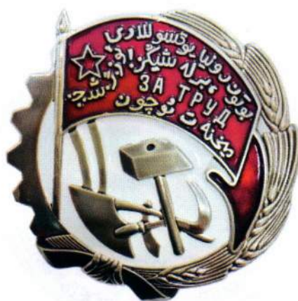
▲ Знак ордена «Трудовое Красное Знамя УзССР» присуждался не только гражданам и коллективам УзССР, но, равным образом, и гражданам, и коллективам всех других республик, входящих в Союз ССР, а также гражданам и коллективам иностранных государств

Дважды, 3 января и 20 марта 1926 г., Президиум ЦИК Узбекской ССР утверждал предлагаемые Секретариатом изменения внешнего вида орденского знака. В итоге к символике узбекского ордена добавился урак, а на знамени вместо надписи