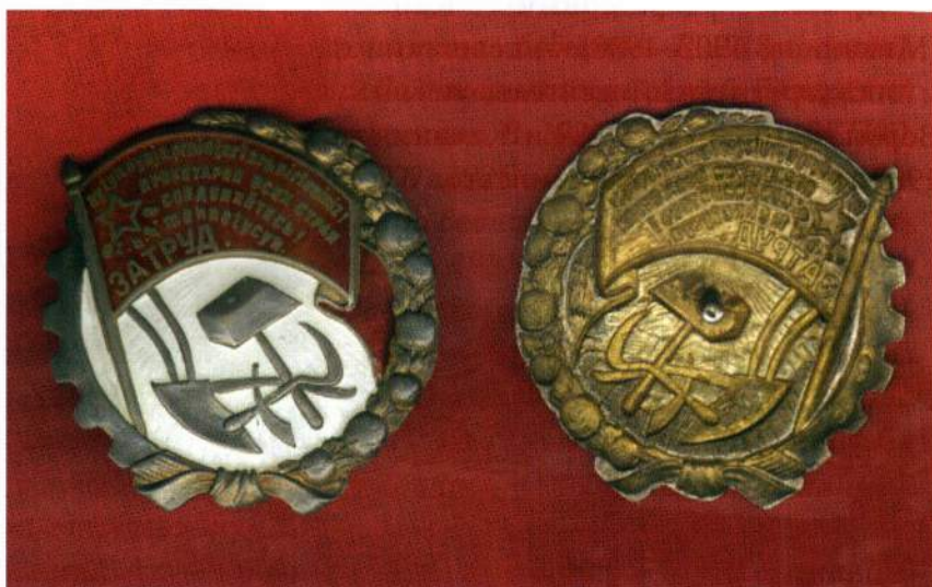
▲ Орден Трудового Красного Знамени Узбекской ССР, образец 1930–1933 гг. Колосья пшеницы заменены на хлопковые коробочки, арабские буквы – на латиницу