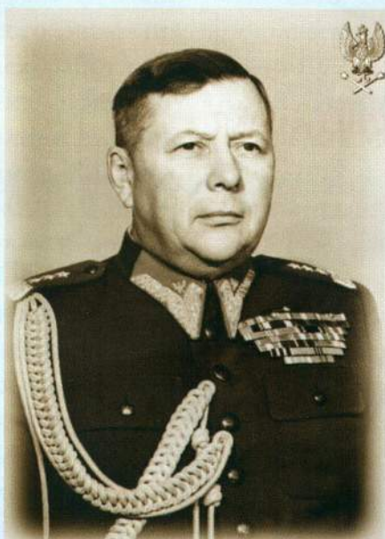
▲ Генерал Бордзиловский

состава того же батальона. В 1926 году вступил в ВКП(б). В 1931 году окончил Военно-Инженерную Академию РККА и был назначен начальником