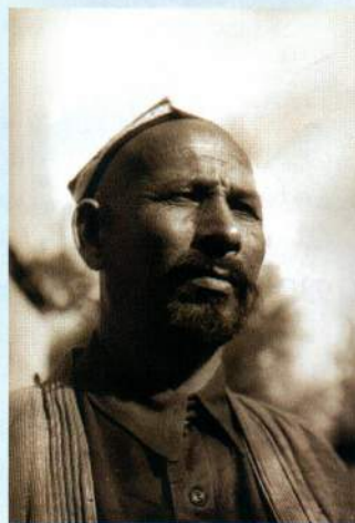
▲ Председатель ЦИК Узбекской ССР Юлдаш Ахунбабаев

Несколько позднее, 22 февраля того же года, отдельным постановлением ЦИК УзССР трудовым орденом Узбекской ССР были награждены руководители проведения реформы в масштабах всей республики: секретарь Среднеазиатского бюро КП(б) Узбекистана И. Зеленский, Председатель ЦИК Узбекской ССР Ю. Ахунбабаев и секретари ЦК КП(б) Узбекской ССР А. Икрамов и В. Иванов. После изготовления первой партии знаков узбекского ордена именно этим ответственным работникам были вручены ордена с порядковыми номерами 1, 2, 3 и 4.