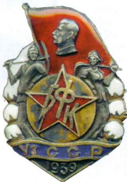
▲ Нагрудный знак «Строителю Большого Ферганского канала», 1939 год

Вовлечение женщин в научную и общественную жизнь республики также оказалось сложной задачей. Только