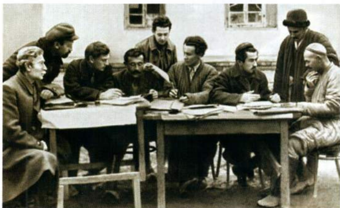
▲ Комиссия по проведению земельно-водной реформы. Ташкентский округ, 1926 год