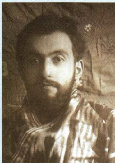
▲ Михаил Ефимович Михайлов (Каценеленбоген)

С марта 1931 г. — зав. орготделом Московского обкома ВКП(б). С января 1932 г. — секретарь по сельскому хозяйству Московского обкома ВКП(б). С февраля 1934 г. он 3-й секретарь Московского обкома ВКП(б). С 10 июня 1935 по