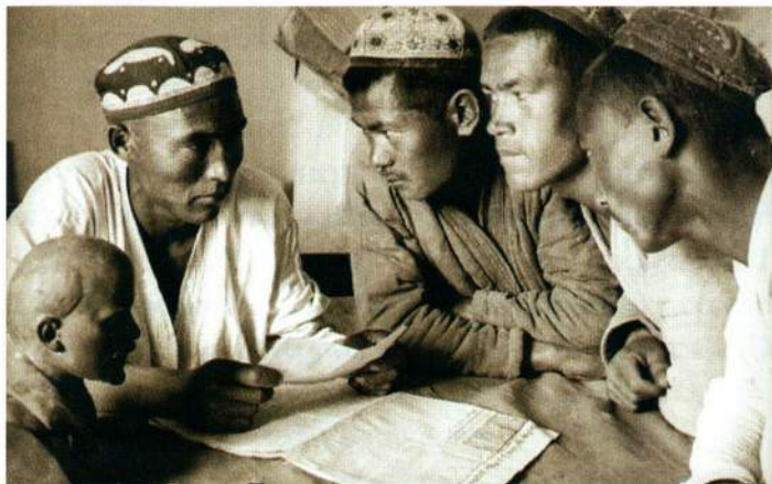
▲ Узбекистан в 1930-е годы.

к середине 1940-х женщины стали получать образование и работать наравне с мужчинами.