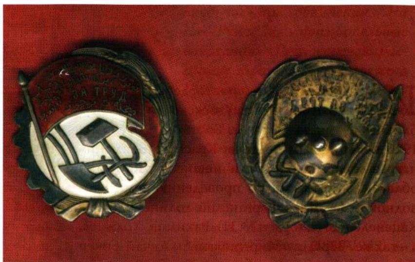
▲ Орден Трудового Красного Знамени Узбекской ССР, образец 1926–1930 гг.

На реверсе первого узбекского ордена образца 1930 года стоял №151. Все ордена старого типа, то есть образца 1926 г., подлежали обмену на новые. Поэтому сегодня орден Трудового Красного Знамени Узбекской ССР с изображением колосьев пшеницы встречается крайне редко. На орденах образца 1926 г. присутствуют следующие клейма: