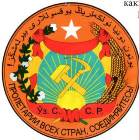
▲ Герб Узбекской ССР, 1931 год

Конституция, принятая II съездом Советов Узбекистана в марте 1927 г., и редакция Конституции, утвержденная IV Всеузбекским съездом Советов в феврале 1931 г., не внесли каких-либо изменений в герб. В текст Конституции (ст. 102) вошло описание герба, принятое в 1925 г.