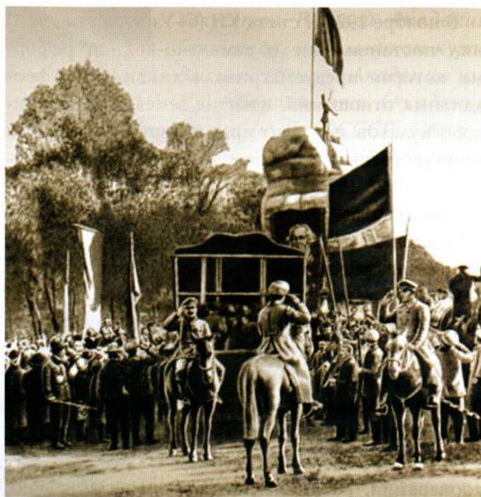
▲ Юлдаш Ахунбаев принимает парад юных пионеров. Ташкент, 1928 год

Образование Узбекской ССР ускорило экономическое, политическое, культурное развитие узбекского народа. Более того — развитие экономики Узбекистана шло быстрее, чем