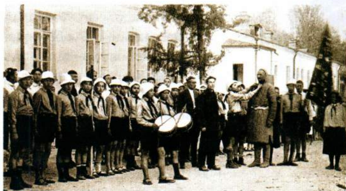
▲ Торжественный митинг в Ташкенте в честь установления Советской власти, 1917 год

по СССР в целом. Почти в десять раз выросла добыча нефти (с 13 тыс. тонн в 1913-м до 119 тыс. тонн в 1940-м). За годы довоенных пятилеток в Узбекской ССР было построено свыше 500 различных промышленных предприятий, в числе