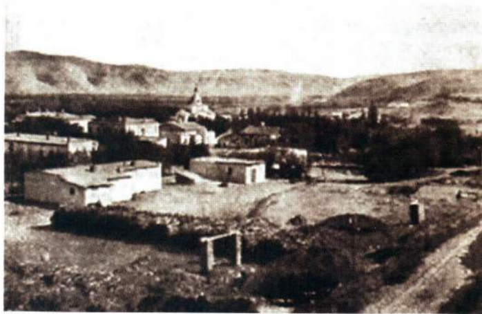
▲ Кушка, фото начала XX века

С декабря 1917 по февраль 1918 г. был рядовым в Красной гвардии, воевал с отрядами Сиверса против формирований атамана Краснова. В феврале 1918 вступил в Красную Армию. В 1920 был назначен командиром эскадрона 33-го Северо-Донецкого полка 6-й кавалерийской дивизии 1-й конной армии, в составе которой штурмовал Каховку и Перекоп, воевал с войсками Врангеля. Орден № 193 Красного знамени получил за то, что одним из первых ворвался в Крым. Орден был вручен в Джанкое М. В. Фрунзе. Был близко знаком с Буденным,