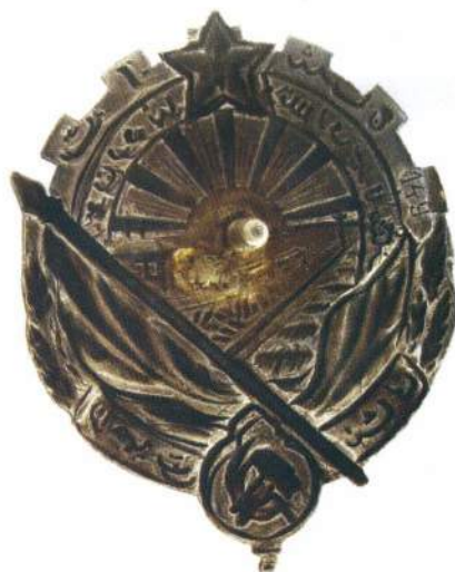
▲ Орден № 149 А. П. Турчинского

председателя ГПУ Туркменской ССР. В настоящее время его награды, в том числе и орден Трудового Красного Знамени Туркменской ССР № 66, хранятся в фондах Государственного Исторического музея.