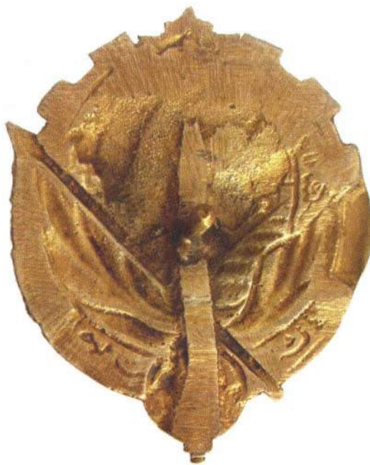
▲ Образец ордена по эскизу А.А.Карелина – лицевая и оборотная стороны

так и коллективов трудящихся, общественных организаций или воинских частей производились постановлениями ЦИК Туркменской ССР по представлениям центральных органов ведомств, научных и культурных учреждений и организаций. В особых случаях представления к награждению утверждались Всетуркменским съездом Советов.