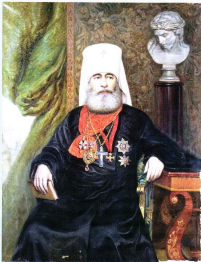
▲ Портрет митрополита Антония работы А.А. Карелина, 1911 год

художественному отделу свою личную коллекцию — более 300 произведений живописи, графики, скульптуры, декоративно-прикладного искусства. Среди них — авторские «Алеша Попович» и «Заморский шут».