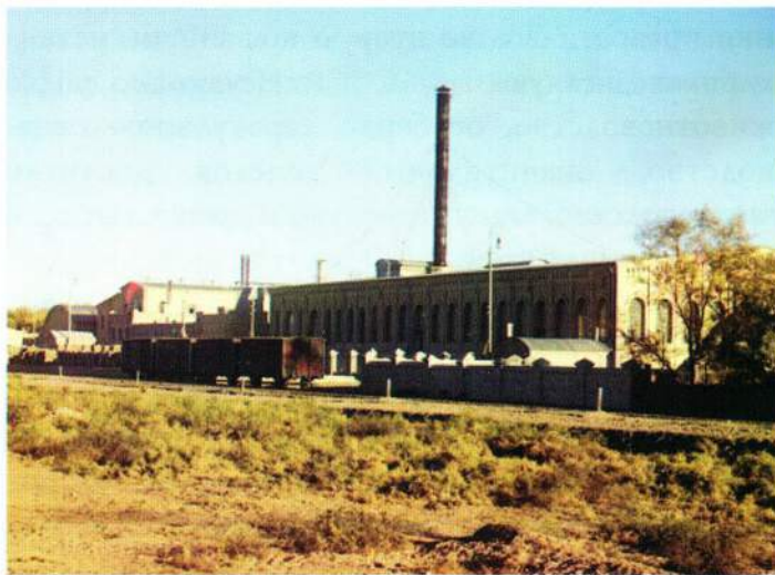
▲ Байрам-Алийский шелкопрядный комбинат. Фото Прокудина-Горского, 1911 год

Особое внимание уделялось развитию хлопководства. Благодаря строительству новых и восстановлению старых оросительных систем, расширялись посевные площади, внедрялись новые высокоурожайные сорта хлопка.