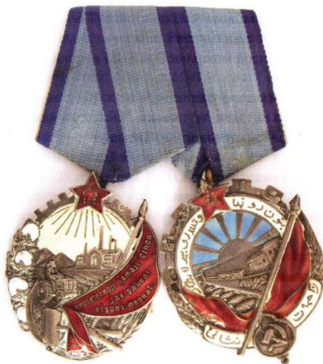
▲ Ордена В.В. Васильева

Всего было произведено 184 награждения орденом Трудового Красного Знамени Туркменской ССР (154 человека и 30 трудовых коллективов и воинских частей). Награждения орденом продолжались до марта 1933 гг.