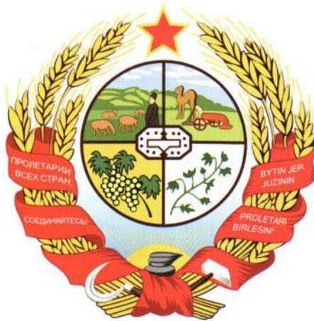
▲ Герб Туркменской ССР в 1926-1937 гг.

В 1921–1922 гг. в области была проведена первая земельно-водная реформа. В результате реформы 7,8 тыс. безземельных хозяйств получили 37,5 тыс. десятин пахотной земли и воду. Все расходы по землеустроительным работам приняло на себя правительство РСФСР. Туркменская область получила сельскохозяйственный кредит в сумме 3 миллиона рублей и 6 миллионов рублей на проведение ирригационных работ.