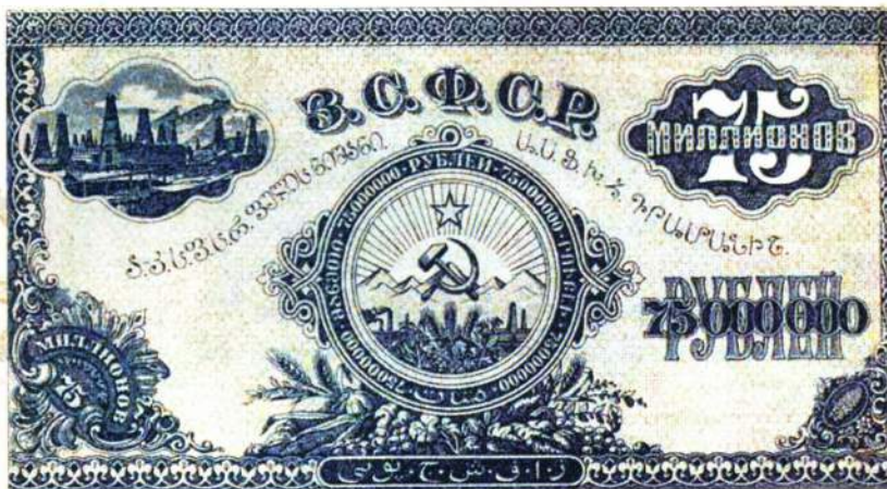
▲ Об экономических трудностях красноречивее всего говорит инфляция тех лет. Она достигала астрономических цифр. В ходу были практически ничего не стоящие «миллионы» (на фото – денежная купюра в 75 миллионов рублей), в реальной цене – только хлеб и золото