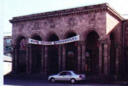
▲ Амо Харазян, театр его имени и его орден Трудового Красного Знамени ЗСФСР