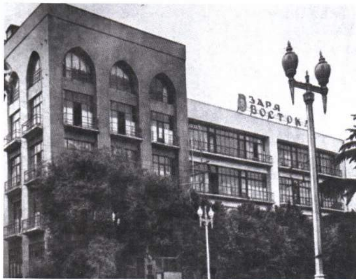
▲ Здание редакции и типографии газеты «Заря Востока» в Тбилиси, 1930-е гг.

Сотрудниками «Зари Востока» в свое время были Исаак Бабель, Владимир Маяковский, Сергей Есенин.