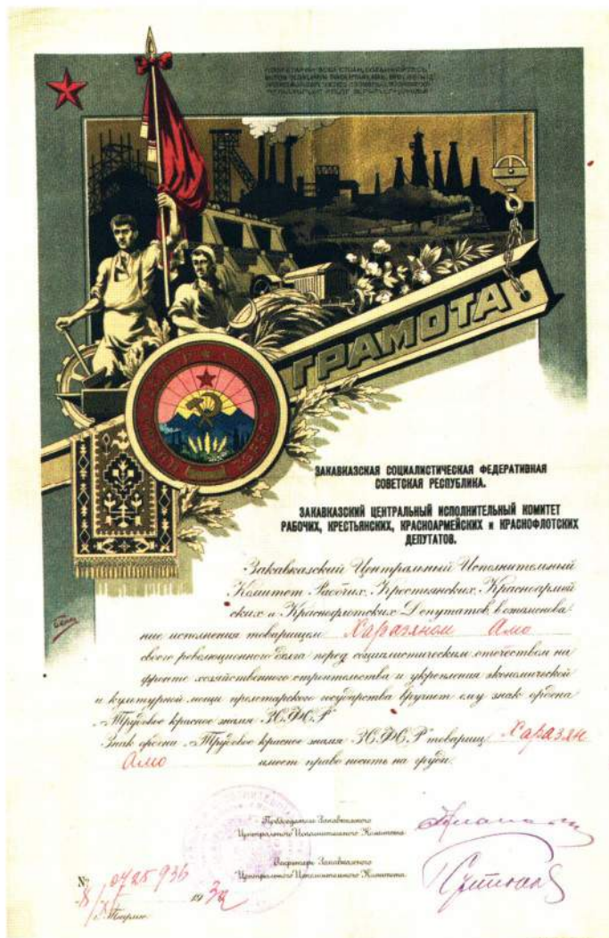
▲ Орденская грамота и орденская книжка Народного артиста Армянской ССР А.Г. Харазяна

Общее количество знаков этого ордена, сохранившихся в различных музеях бывшего Советского Союза и частных коллекциях, составляет не более 50 экземпляров.