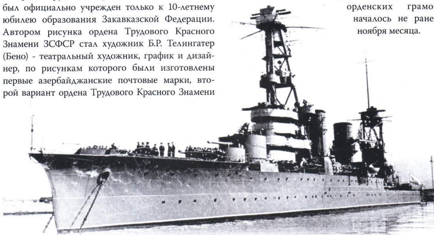
▲ Крейсер «Красный Кавказ»

Вручение орденов и орденских грамот началось не ранее ноября месяца.