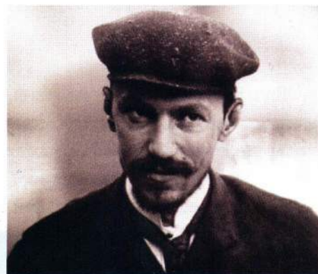
▲ Менжинский в 1917 году

С 15 сентября 1919 г. особо уполномоченный Особого отдела ВЧК и член Президиума ВЧК. В 1920-1922 гг. начальник Особого и Секретно-политического отделов ВЧК. С июля 1922 г. одновременно член Коллегии ВЧК. Считался «интеллектуалом» и наименее одиозной фигурой в ВЧК. Тем не менее он был одним из главных организаторов массовых расстрелов и внесудебных репрессий в стране. Под его руководством, согласно официальной истории, было ликвидировано 89 крупных «банд», в которые входило около 56 тыс. человек. Организатор наиболее шумных провокаций ВЧК, в т.ч. «дела Б.В. Савинкова». Причастен ко всем кровавым мероприятиям ВЧК. С 18 сентября 1923 г. - 1-й заместитель председателя ОГПУ Ф.Э. Дзержинского, при этом, учитывая, что Дзержинский