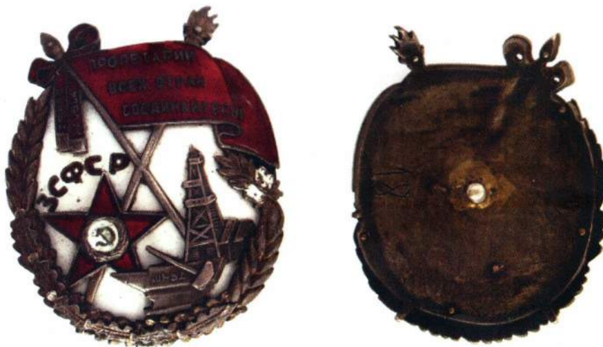
▲ Орден Трудового Красного Знамени ЗСФСР, лицевая и оборотная стороны