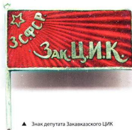
▲ Знак депутата Закавказского ЦИК