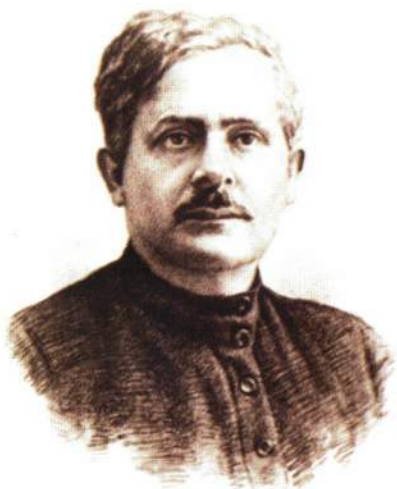
▲ Амель Енукидзе

Трудовым орденом Закавказья был награжден и секретарь ЦИК СССР Амель Сафронович Енукидзе (1877-1937), советский государственный и политический деятель, близкий друг Сталина.