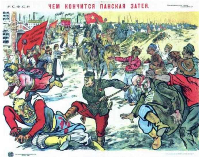
▲ «Чем кончится панская затея». Советский плакат 1920 г.

также обязалась уплатить Польше в течение года 30 млн золотых рублей за вклад Польши в хозяйственную жизнь Российской империи и передать Польше имущества на сумму 18 млн золотых рублей. Сама Польша освобождалась от ответственности за долги и иные обязательства бывшей Российской империи.