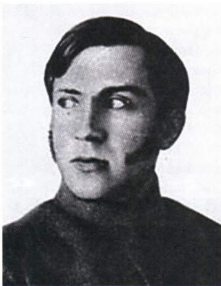
▲ Трижды кавалер ордена Красного Знамени РСФСР В.К. Путна

С мая 1918 г. он был военкомом Витебского военного комиссариата, с сентября 1918 г. по май 1919 г. – комиссаром 1-й Смоленской дивизии, с мая 1919 г. – командиром 228-го Карельского полка, с июля – командиром 2-й бригады этой дивизии, с декабря 1919 г.