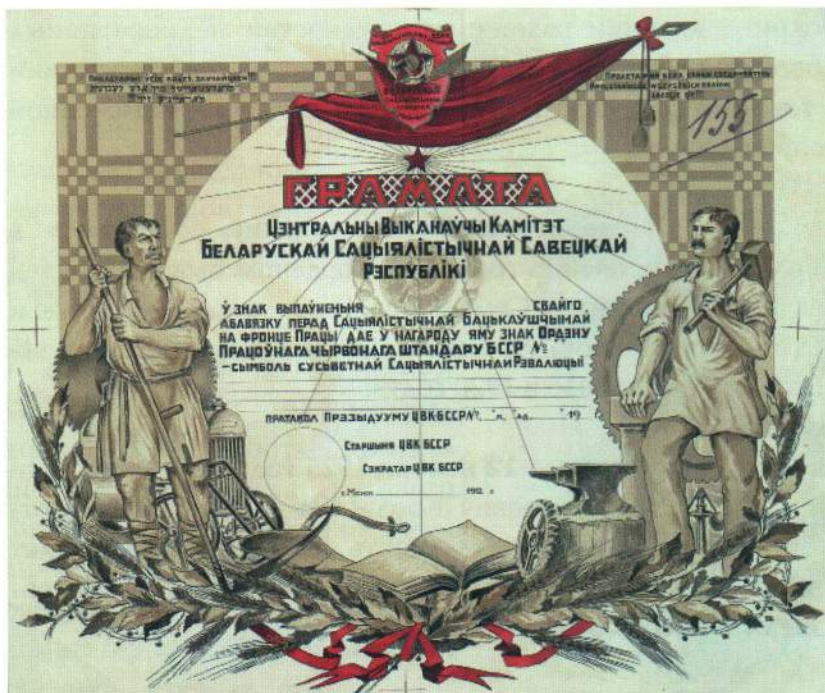
▲ Образец грамоты к ордену

Знамени БССР», орденских книжек и грамот не соответствуют Конституции БССР, эмблема ордена искажена (вместо серпа и молота изображен серп и топор, вместо инициалов «БССР» написано: «Беларуская Сацыялістычная Савецкая Рэспубліка», а инициалы «БССР» написаны на польском и еврейском языках, вместо «Пролетарыі ўсіх краін, злучайцеся!» написано «Пролетарыі ўсіх краёў злучайцеся»), орденские книжки и грамоты подписаны врагами народа...».