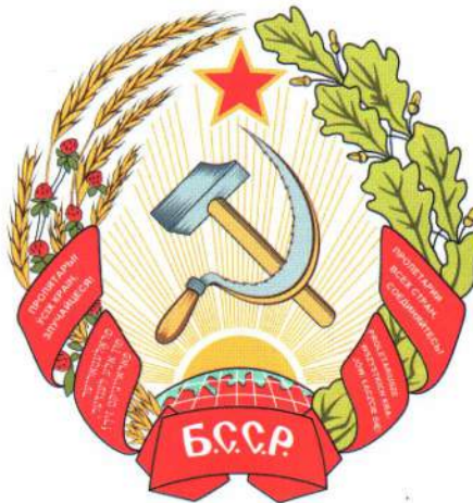
▲ Герб БССР 1927 г.

16 мая 1924 г. Президиум ЦИК БССР рассмотрел вопрос «О выработке проекта Белорусского ордена Трудового Знамени и устава этого ордена». Проект ордена было поручено разработать Комиссии по созданию герба БССР. Подготовкой рисунка, взяв за основу упомянутый выше эскиз герба,