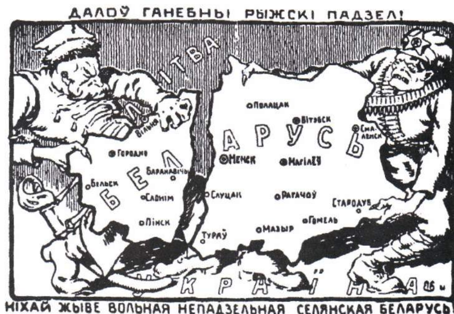
▲ «Долой позорный Рижский раздел! Пускай живет свободная неделимая крестьянская Беларусь!», белорусская карикатура, 1921

Год понадобился Красной Армии на то, чтобы, разобравшись с внутренними врагами, выбить поляков со значительной части территории Белоруссии. 31 июля 1920 года в Минске была вновь провозглашена Белорусская Социалистическая Советская Республика,