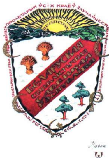
▲ Проект герба Змудзинского 1924 г.

Уже в начале июля проект был представлен на рассмотрение, а 25 июля 1924 г. — утвержден Президиумом ЦИК БССР.