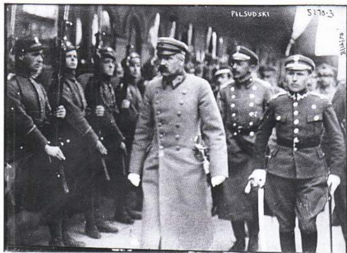
▲ Юзеф Пилсудский в Минске. 1919

В марте 1924 и декабре 1926 годов часть территории РСФСР, а именно: части Витебской, Смоленской (с Оршей), Гомельской (с Гомелем) губерний были переданы в состав Белорусской ССР. До 1936 года официальными языками республики наряду с белорусским и русским были польский и идиш. После раздела Польши между Гитлером и Сталиным в 1939 году к БССР отошла Западная Белоруссия.