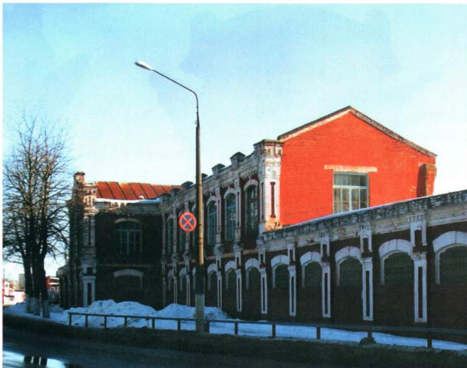
▲ Комплекс зданий бумажной фабрики «Герой труда» Добруша

Белорусская ССР, крайне трепетно относившаяся к своей награде, нередко вручала ее коллективам, причем не только трудовым, но и военным. Среди орденосцев БССР можно назвать минские заводы «Большевик» и «Энергия», витебский завод сельхозмашин «Красный металлист», 8-ю авиабригаду, 8-ю Минскую дивизию, 7-й Конноартиллерийский полк. Несколько воинских частей были удостоены трудового ордена БССР за строительство канала Орша – Лепель в 1925 г. Ордена, врученные коллективам, должны были крепиться на их знаменах.