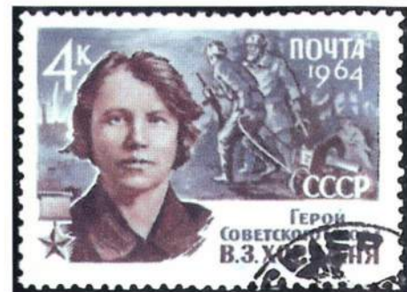
▲ Почтовая марка СССР с изображением Веры Хоружей, 1964 г.

В 1932 г. был награжден Иосиф Бенцианович Симановский (1892-1967) – видный деятель культуры Белоруссии, один из организаторов библиотечного дела в республике.