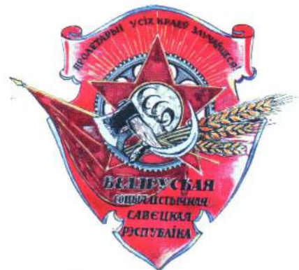
— ПРОЕКТ ОРДЕНА — Трудового Красного Знамени

Тем не менее, в Статут ордена Трудового Красного Знамени БССР изменения, касательно положений о льготах, вносились