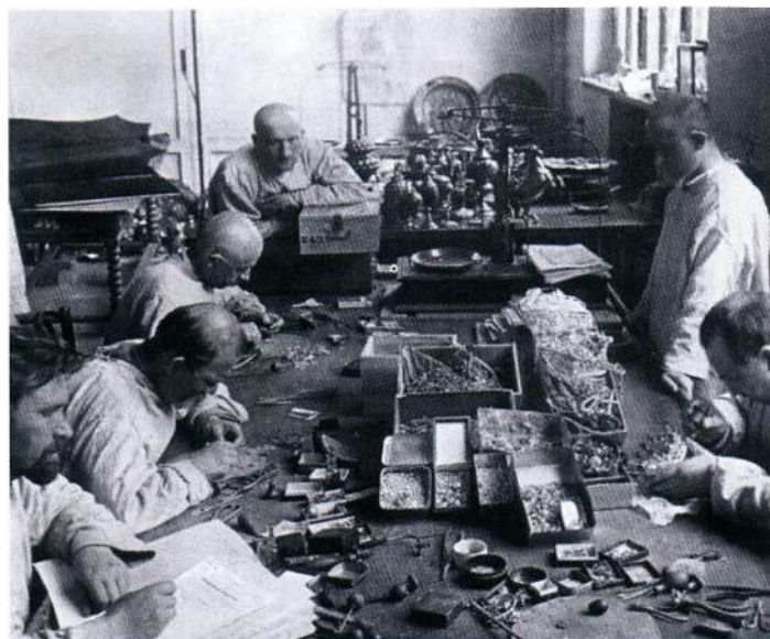
▲ Ювелирные мастерские Кавказа всегда славились качеством своей работы

Исходя из имеющихся экземпляров, можно предположить, что порядковые номера орденов первых двух групп доходят до номера 100, а третьей – начинаются с номера 101. Если заказ на изготовление орденов действительно размещался в двух мастерских – С.Степанова и братьев Тер-Аристакесянов, то логичным кажется размещение в двух мастерских равных партий наград – по 100 штук.