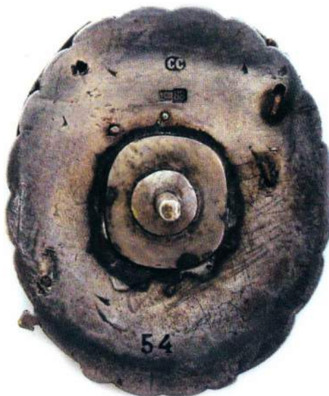
▲ Орден №54 Левона Карапетяна, ГИМ