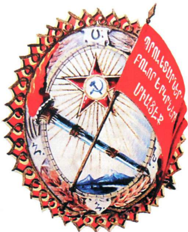
▲ Эскиз ордена

изготавливались двумя партиями в обеих вышеозначенных мастерских.