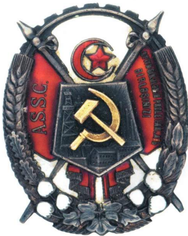
▲ Орден Трудового Красного знамени АзССР (второго типа), существовавший до 1933 г. Из коллекции Государственного исторического музея

Над щитом, на фоне белой эмали изображены красные эмалевые полумесяц и звезда. Щит наложен на два перекрещенных красных знамени с надписями на азербайджанском языке (латинский алфавит): на левом – «АССР», на правом – «Пролетарии всех стран, соединяйтесь!». Размер ордена – 52×42 мм. Изготавливался из серебра 875 пробы.