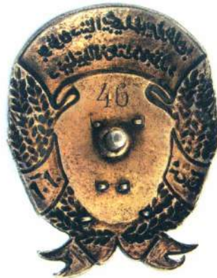
◀ Орден Трудового Красного знамени АзССР (первого типа)