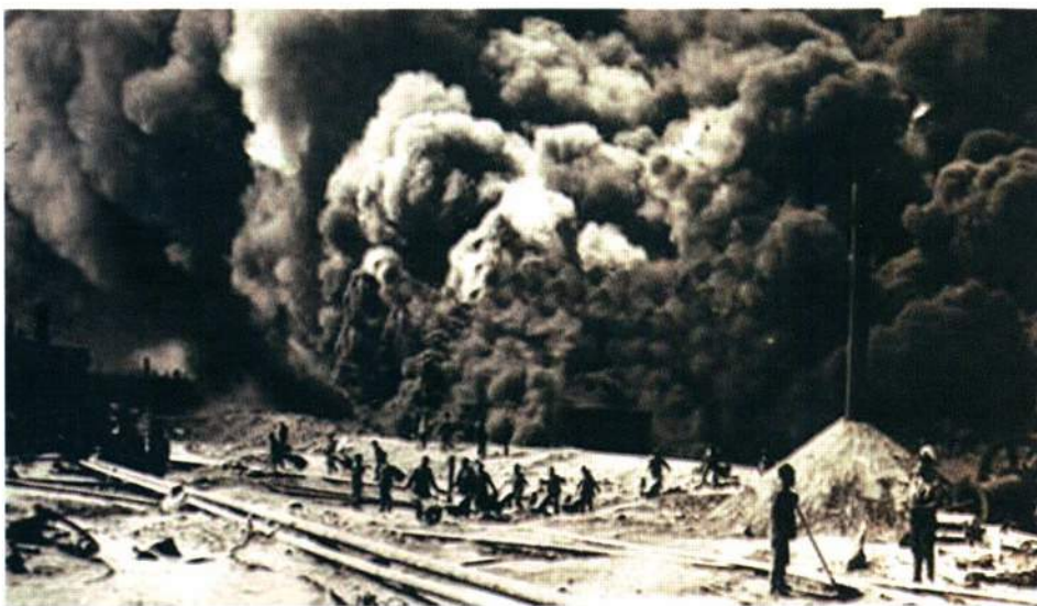
▲ Пожар на нефтепромысле в Баку

Также награды были удостоены газета «Бакинский рабочий» (в 1923 г) и газета «Коммунист» (в 1924 г).