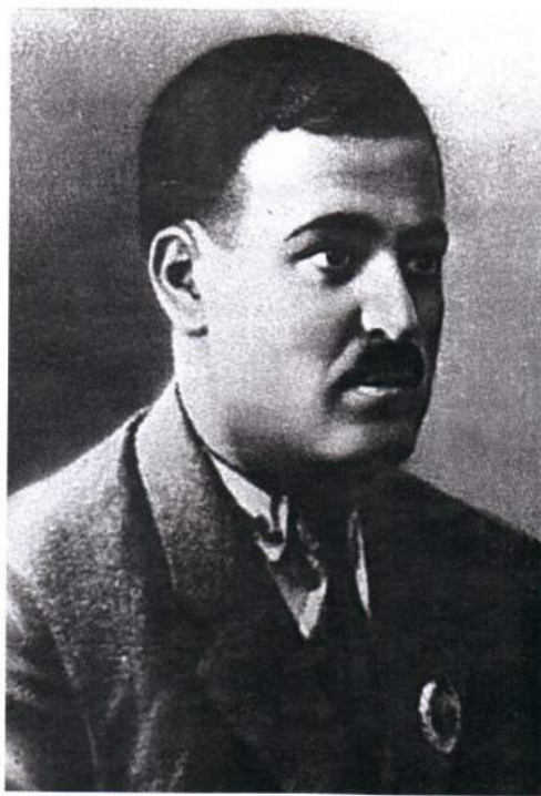
▲ Дадаш Ходжа оглы Буниатзаде

Дадаш Буниатзаде родился 8 апреля 1888 года в селении Фатмаи в крестьянской семье. В марте 1917 года он стал членом временного комитета «Гуммет», а с июля — членом редколлегии большевистской газеты «Гуммет» («Энергия»). С мая 1918 года — член исполкома Совета Бакинского уезда и чрезвычайный уполномоченный по борьбе с контрреволюцией и бандитизмом.