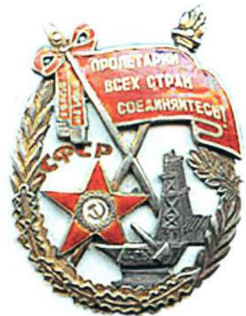
▲ Орден Трудового Красного Знамени ЗСФСР

Вообще практика награждений республиканскими орденами сосуществовала с награждениями орденами СССР (а для закавказских республик — еще и орденом ЗСФСР) до конца 1933 г.