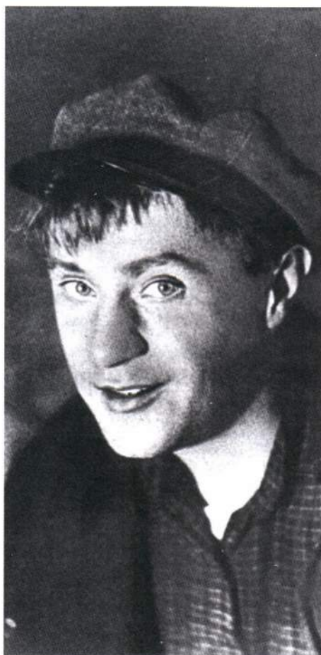
▲ Михаил Жаров в спектакле Бакинского Рабочего театра