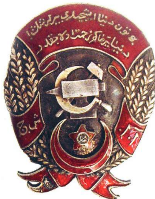
▲ Первый вариант ордена Трудового Красного Знамени Азербайджана

Знаки ордена Труда АзССР изготавливались теми же ювелирами и в тех же бакинских мастерских, что и ордена боевого Красного Знамени АзССР. Орден изготавливался из серебра, отделывался красной эмалью и позолотой. В центре знака располагалось рельефное изображение наковальни, серпа и молота, символизирующие труд. Под ними находился фрагмент герба республики – полумесяц с пятиконечной звездой с изображением на ней серпа и молота. Сверху, по эмалевой ленте, шла двухстрочная надпись на азербайджанском языке арабской графикой: «Bütün dünya işçiləri, birləşiniz! Dünyaya hakim zəhmət olacaqdır» («Пролетарии всего мира, соединяйтесь! Миром будет править труд»). Орден был окаймлен тремя рядами позолоченных колосьев, опоясанных с обеих сторон эмалевой лентой, на которой арабские буквы - аббревиатура названия республики: «Azərbaycan İctimai Şura Cümhuriyyəti» («Азербайджанская Социалистическая Советская Республика»).