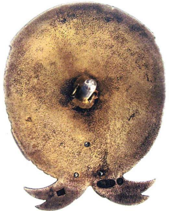
▲ Орден Трудового Красного знамени АзССР (первого типа), вариант Румянцева. Из коллекции Государственного исторического музея