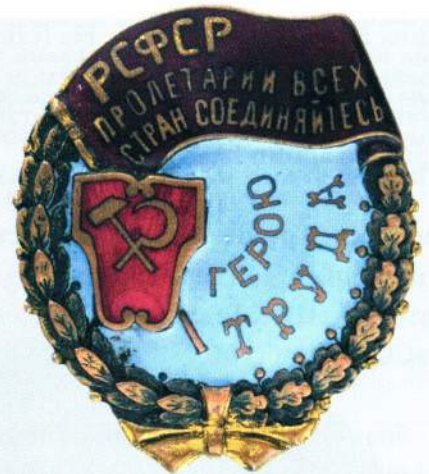
▲ Орден Трудового Красного Знамени РСФСР

С апреля 1921-го по январь 1933 года было произведено 163 награждения. Кроме отдельных людей, орден получили 43 рабочих коллектива и один регион - Дагестанская АССР.