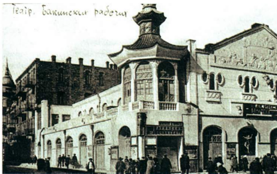
▲ Архивное фото: фасад Бакинского рабочего театра, 1929 год

29 мая 1925 года постановлением ЦИК СССР трудовым орденом были награждены руководители нефтяной промышленности Азербайджана, большинство из которых буквально через