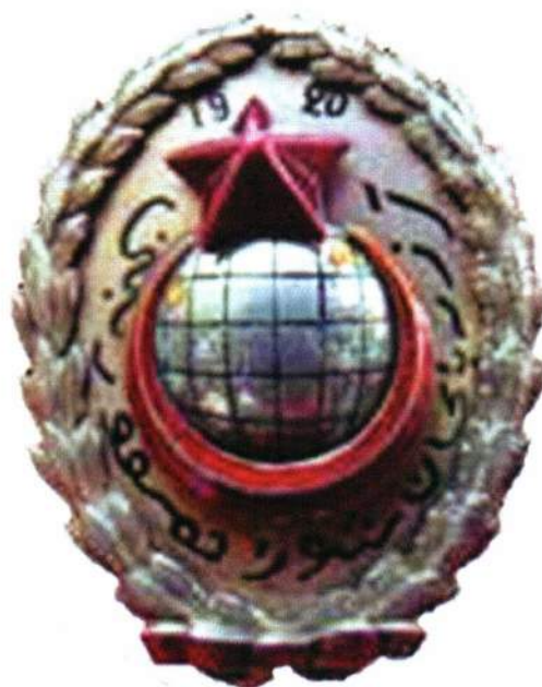
▲ «Почетный Пролетарский Нагрудный Знак» Азербайджанской ССР

Награждения производились постановлением Азревкома по представлению наркомата по военным и