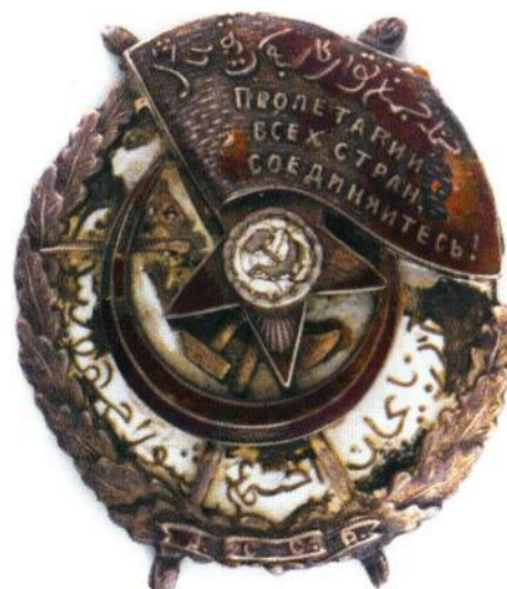
▲ Ордена Красного Знамени РСФСР (а затем – СССР) послужили идеологической «основой» для создания аналогичных наград национальных советских республик