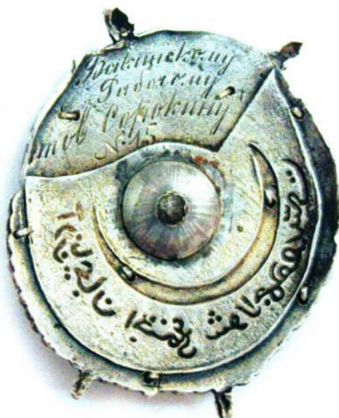
◀ Орден Красного Знамени АзССР №15, врученный рабочему Сорокину (из коллекции ГИМ)