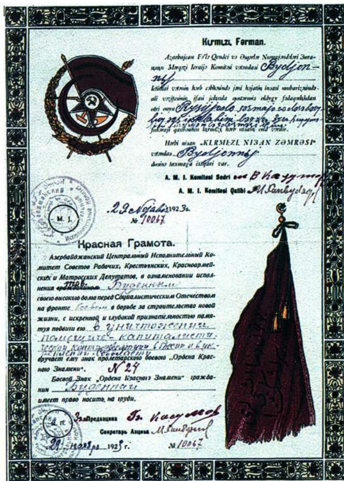
▲ Орденская грамота Буденного (из коллекции ГИМ)

Орджоникидзе. Он принимал непосредственное участие в свержении правительств Азербайджана, Армении и Грузии и создании ЗСФСР. С 1922 г. Орджоникидзе становится первым секретарем Закавказского, с сентября 1926 г. – Северокавказского крайкома РКП(б). В 1926–1930 гг. Орджоникидзе — председатель ЦКК ВКП(б), нарком рабоче-крестьянской инспекции и зампреда СНК СССР. В качестве признания заслуг Орджоникидзе ему был вручен орден №9, выполненный не из серебра, а из чистого золота.