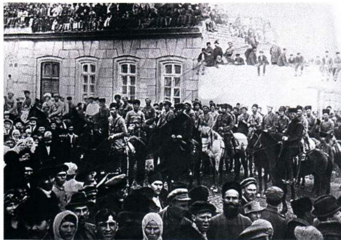
▲ Части Красной Армии входят в Баку. Апрель 1920 года

4. Для всех служащих и рабочих устанавливается восьмичасовой рабочий день.