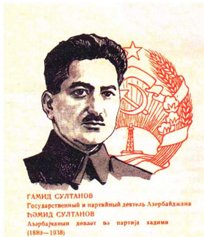
▲ К 100-летию со дня рождения Гамида Гасан оглы Султанова в СССР был выпущен специальный памятный конверт

Летом 1919 года он был направлен в Закавказье на подпольную работу. С февраля 1920 года - член ЦК Азербайджанского КП(б) и Центрального военно-боевого штаба при Бакинском бюро Кавказского крайкома РКП(б).