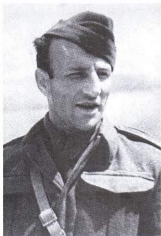
▲ Первый Герой Советского Союза иностранец Отакар Ярош

Среди получивших звание Героя Советского Союза за ратные подвиги в годы войны были русские, украинцы, белорусы, татары, евреи, азербайджанцы, казахи, грузины, армяне, узбеки, мордвины, дагестанцы, чуваша, башкиры,