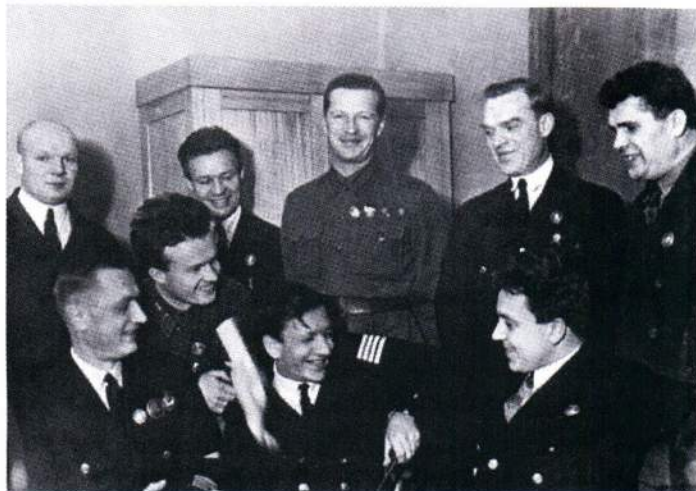
▲ Первые герои Советского Союза: И.В. Доронин, М.Т. Слепнев, Н.П. Каманин, В.С. Молоков, М.М. Громов, С.А. Леваневский, А.В. Ляпидевский (сидит), М.В. Водопьянов

Нумерация медалей для первого, второго и третьего награждения была отдельная. Так как строительство грандиозного Дворца Советов в Москве в связи с войной закончено не было, то бюсты трижды Героев устанавливались в Кремле.