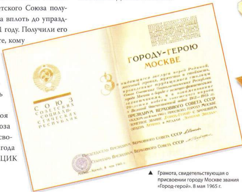
▲ Грамота, свидетельствующая о присвоении городу Москве звания «Город-герой», 8 мая 1965 г.