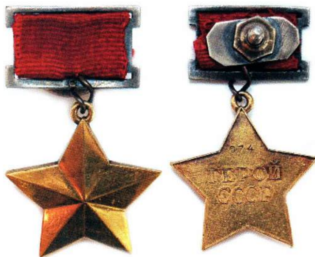
▲ «Золотая Звезда» Героя Ивана Зайкина (из коллекции ГИМ)

В Гражданскую войну сначала воевал на стороне белых в 18-м Донском казачьем полку Донской армии. В 1918 году попал в плен и перешел на сторону красных. С 24 по 30 июня 1919