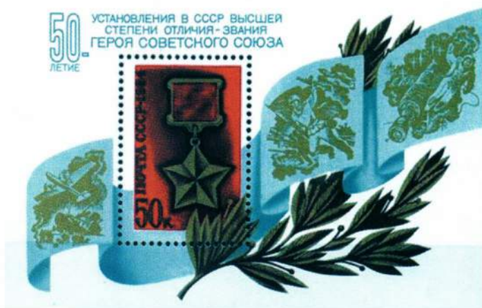
▲ Почтовая марка 1984 года, выпущенная к 50-летию установления звания Героя Советского Союза

Жилая площадь, занимаемая указанными лицами и членами их семей, оплачивается в размере 50 процентов