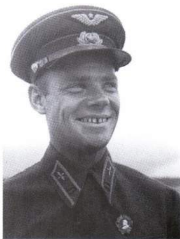
▲ Первый дважды Герой Советского Союза майор Сергей Иванович Гриצעев