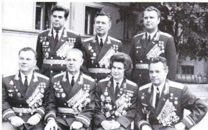
▲ Космонавты - Герои СССР