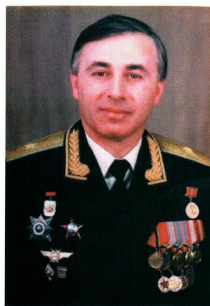
▲ Генерал-майор авиации Суламбек Осканов

Медаль «Золотая Звезда» № 0455 Героя России Качуевской хранится ныне в Государственном историческом музее.