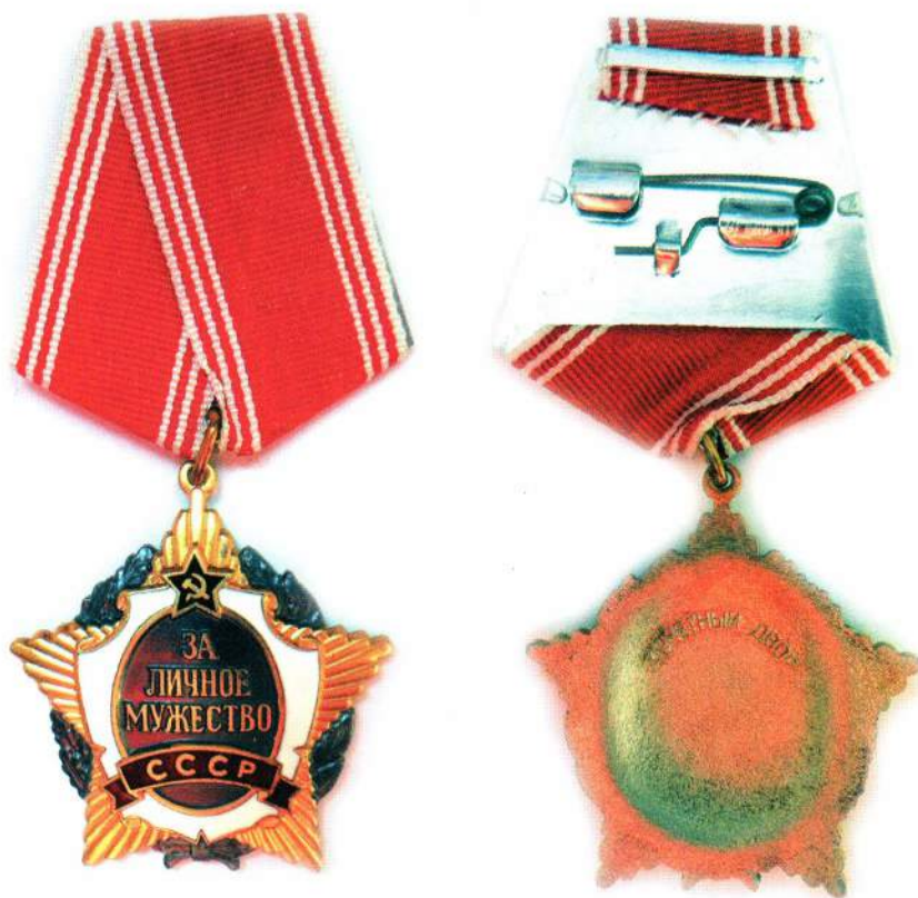
▲ Орден «За личное мужество», лицевая и оборотная стороны, ГИМ

Планка с лентой ордена носится после планки ордена «Знак Почета»