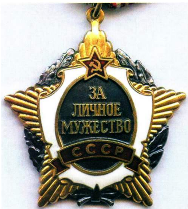
▲ Орден «За личное мужество»