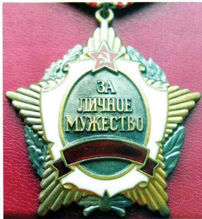
▲ Орден «За личное мужество» 1992-1994 гг