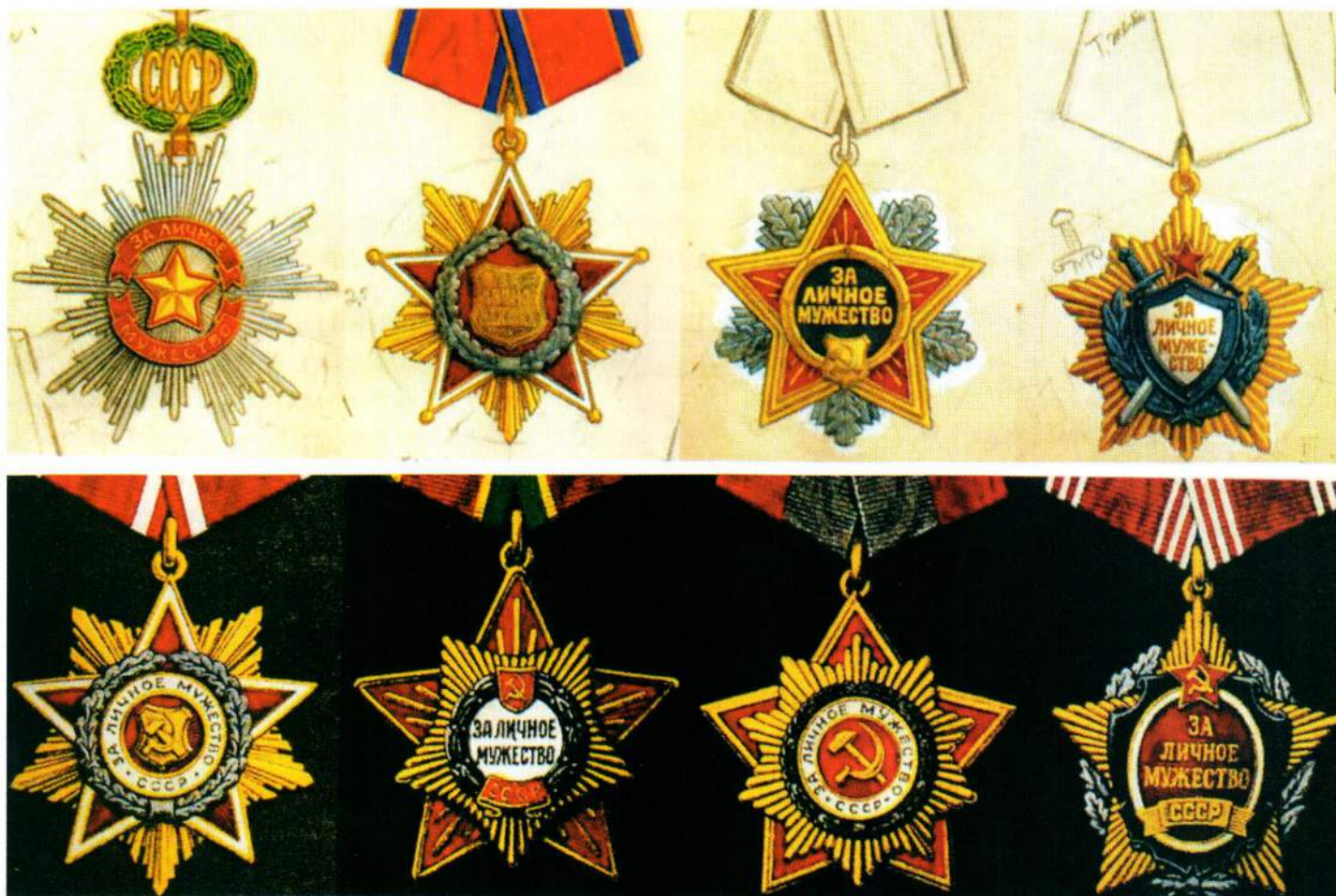
▲ Проектные рисунки авторства А. Б. Жука

«Орден «За личное мужество» создавался как совершенно новый орден, и никакие «отправные моменты» сверху художникам не навязывались. Но мне посоветовали не пренебрегать тем декором, который раньше предлагался мной на одном из вариантов «Знака Почета» и который в свое время (1988) был одобрен. Я его действительно использовал и