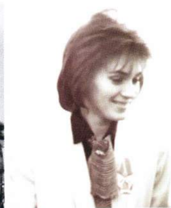
▲ Обаятельная учительница стала для родителей спасенных детей самым близким человеком. И символом самоотверженности для всей страны. Увы – уже падающей в бездну...