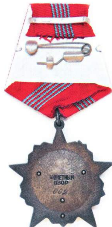
▲ Орден для мегаполиса: «Октябрьская революция» №2, которым была награждена Москва. Орден хранится в Государственном историческом музее

народа на выполнение задач хозяйственного и культурного строительства, Президиум Верховного Совета СССР Указом от 4 мая 1972 года наградил это издание орденом Октябрьской Революции.