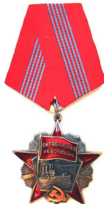
▲ Орден Октябрьской Революции № 21 В. И. Чуйкова хранится вместе с другими его наградами в Государственном историческом музее

Орденом Октябрьской Революции были награждены 21 учебное заведение, а также 62 предприятия, учреждения и организации. Среди орденосных коллективов можно отметить московский инструментальный завод «Калибр» (1971), ленинградский завод