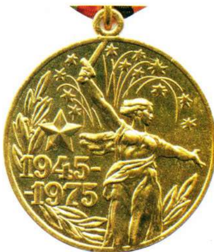
▲ Медаль «Тридцать лет Победы в Великой Отечественной войне»