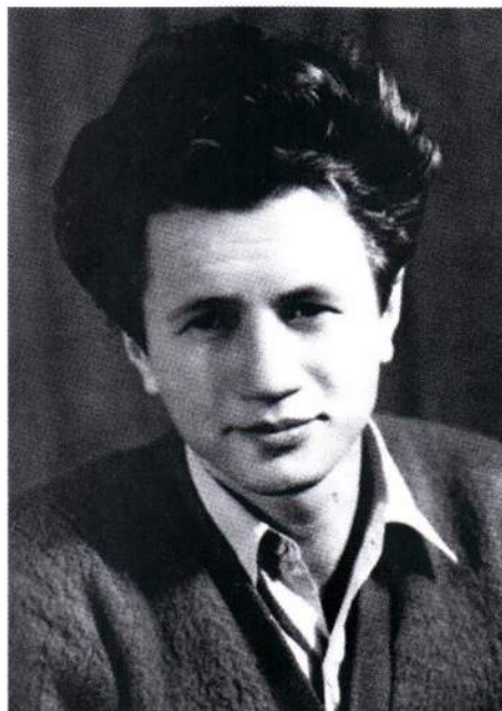
▲ Быков до сих пор – один из любимейших актеров не только Украины, но и всего бывшего СССР