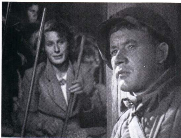
▲ Борис Андреев в фильме «Два бойца»

В 1972 году орден получил Алексей Николаевич Грибов (1902—1977) советский актер театра и кино, педагог. Народный артист СССР (1948). Герой Социалистического Труда (1972). Лауреат четырех Сталинских премий (1942, 1946, 1951, 1952).