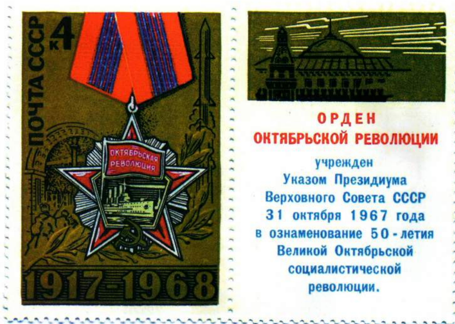
▲ Почтовая сценка, посвященная ордену Октябрьской Революции, 1968 г.

Планка с орденской лентой носится после планки ордена Ленина.