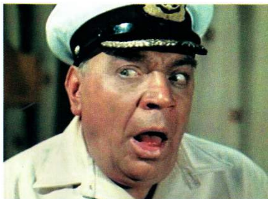
▲ Алексей Грибов больше всего известен современному зрителю по роли капитана корабля из фильма «Полосатый рейс»

По состоянию на 1 января 1995 года орденом Октябрьской Революции было произведено 106462 награждения.