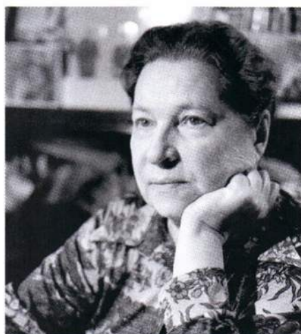
◀ Агния Барто