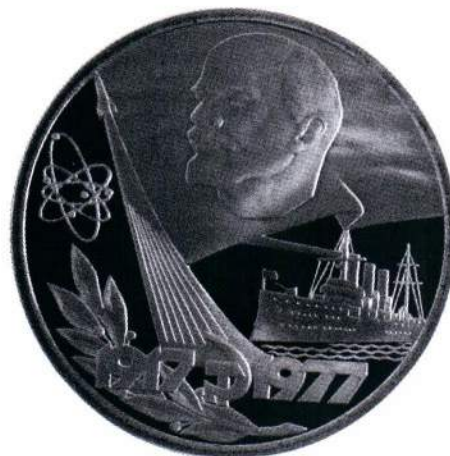
▲ Юбилейная монета к 60-летию Октябрьской Революции. Автор: Валентин Зайцев