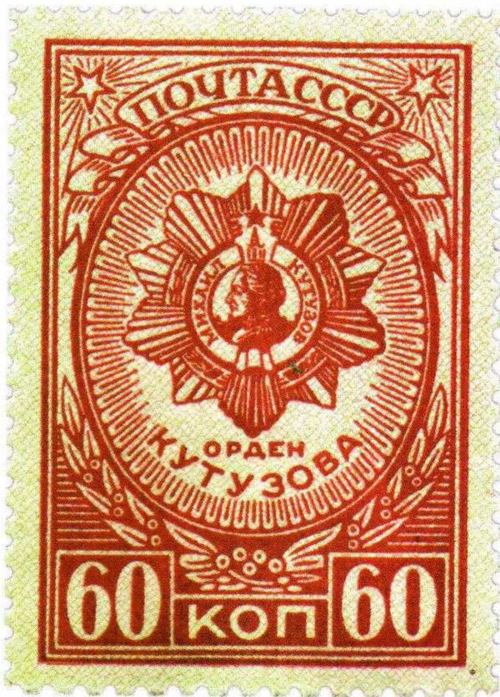
▲ Почтовая марка с изображением ордена Кутузова (1944 год)

Серебряного содержания в ордене второй степени – 36,161 \pm 1,391 гр. Общий вес ордена – 37,3 \pm 1,7 гр.