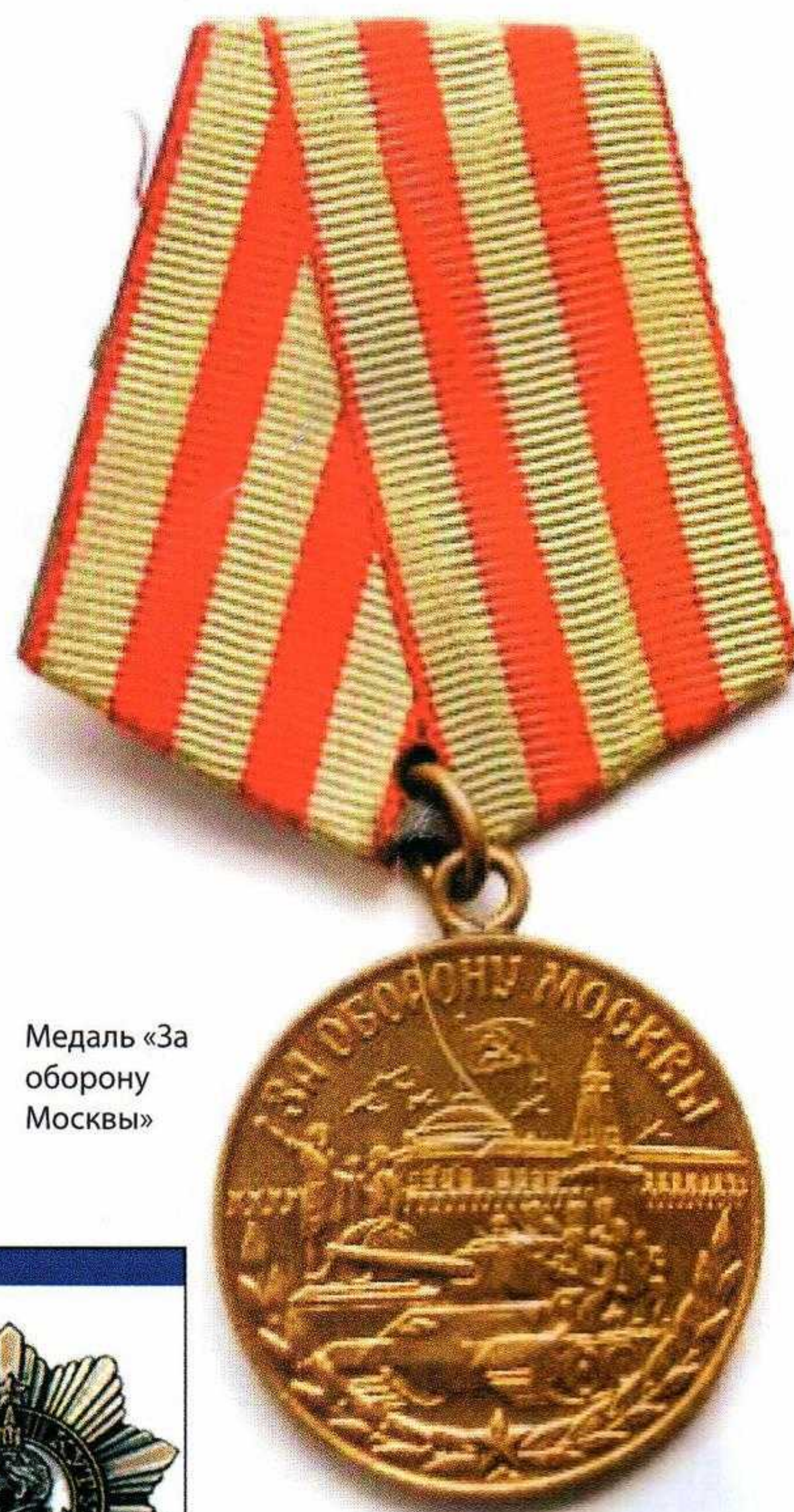
► Медаль «За оборону Москвы»