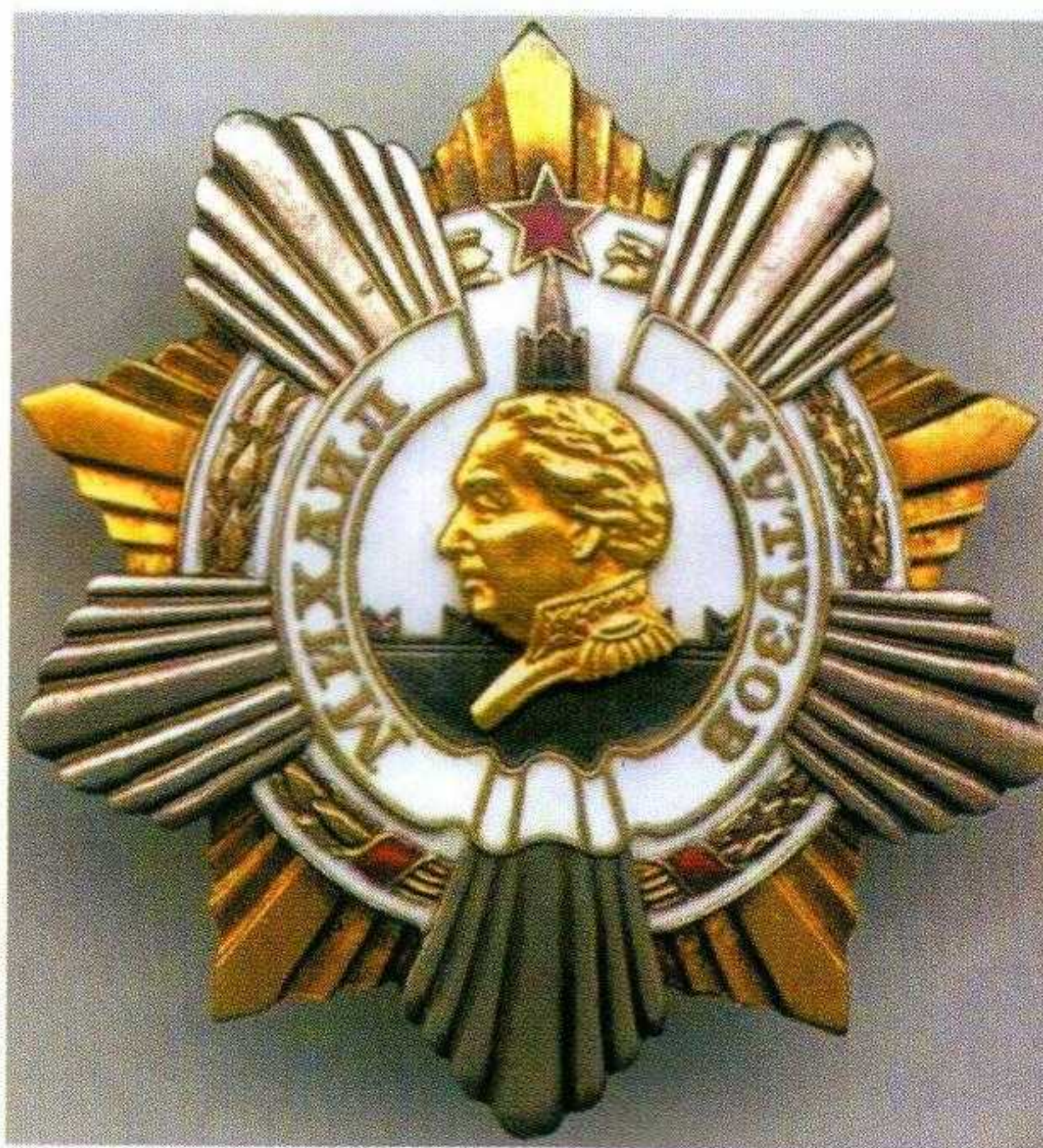
▲ Орден Кутузова I степени, образца 1943 г.

Знак ордена Кутузова III степени не имеет эмали в центральном круге и на звездочке, венчающей кремлевскую башню. Изображение Кутузова, лента, опоясывающая круг, и надпись на ленте оксидированные.