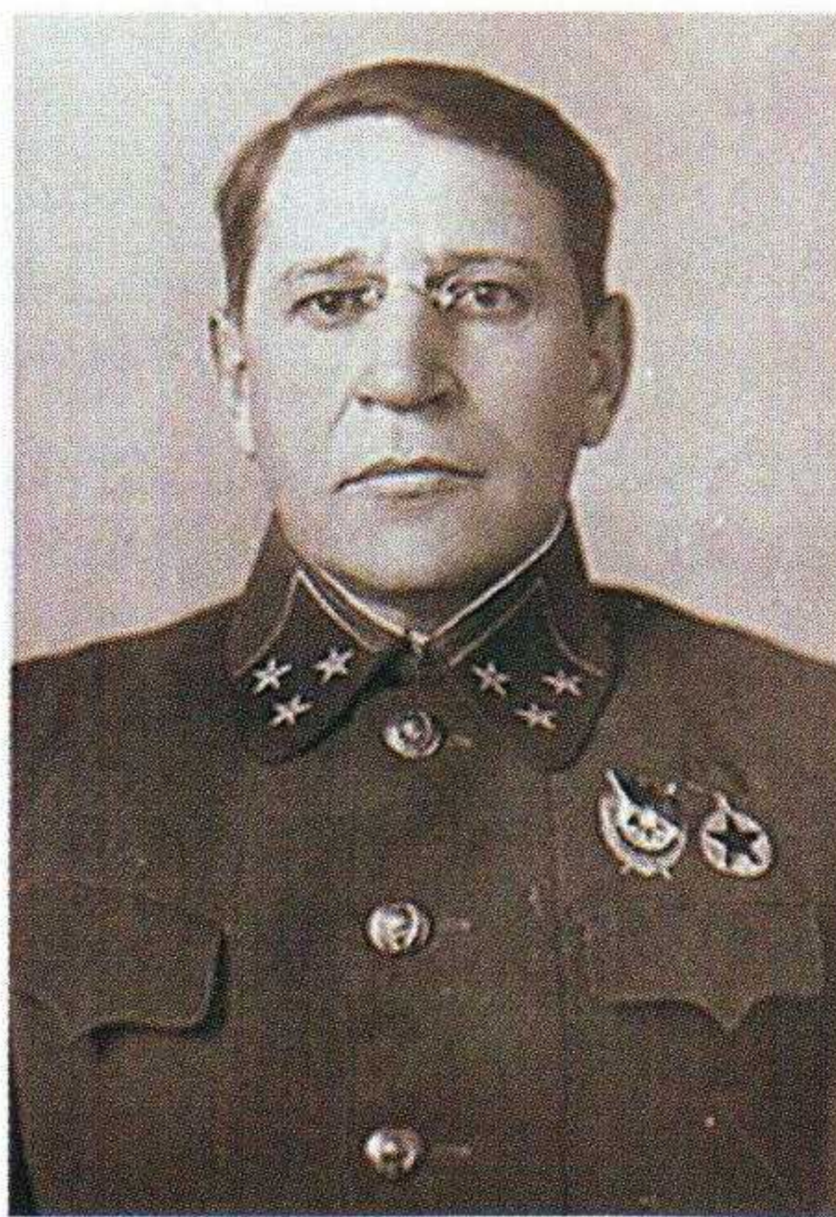
▲ Командующий Калининским фронтом генерал-полковник М. А. Пуркаев

Аналогичная награда генерал-полковника Пуркаева стала своеобразным «утешительным призом» военачальнику, командующему Калининским фронтом. Дело в том, что первоначально армейское и фронтовое командование планировало провести краткосрочную наступательную операцию по овладению важными железнодорожными узлами: городами Великие Луки и Новосокольники. Однако прибывший 19 ноября представитель Ставки маршал Жуков уточнил цель операции следующим образом: сковывание противника на данном участке фронта и недопущение переброски его войск на юг, в район Сталинградской битвы. По всей видимости, Жуков имел тогда в виду не только поддержку операции «Уран» под Сталинградом, но и проводившуюся силами Западного и Калининского фронтов операцию «Марс», целью которой являлось окружение 9 армии, группы армий «Центр». При этом фронтовая Великолукская наступательная операция должна была осуществляться на вспомогательном направлении и силами одной 3-й ударной армии, располагавшейся на правом крыле Калининского фронта и в операции «Марс» не задействованной. Таким образом Пуркаев сразу оказался на вторых ролях и в итоге не смог взять Новосокольники, как планировалось изначально. Зато выполнил директиву Ставки, за что и был награжден.