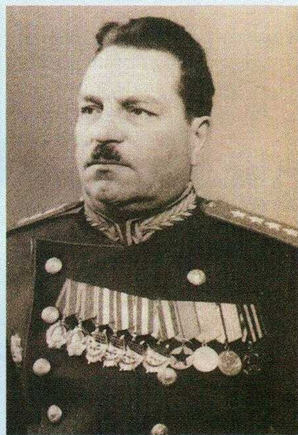
▲ Командующий Закавказским фронтом генерал армии И. В. Тюленев

Судьба Ивана Владимировича Тюленева могла сложиться совсем по-другому. В августе 1941 года, командуя Южным фронтом, он совершил такие грубейшие стратегические ошибки, что вызвал неподдельную ярость Сталина. Тот писал: «Комфронта Тюленев оказался несостоятельным. Он не умеет наступать, но не умеет также отводить войска. Он потерял две армии таким способом, каким не теряют даже и полки... Мне кажется, что Тюленев деморализован и не способен руководить фронтом». В устах вождя это означало одно – трибунал. От расстрела Тюленева спасло только тяжелое ранение, полученное под Днепропетровском 29 августа 1941 года. До 13 октября комфронта находился на лечении в Центральном военном госпитале в Москве. После чего подостывший уже главком сослал Тюленева подальше с глаз – в Уральский военный округ, формировать резервные дивизии для фронта.