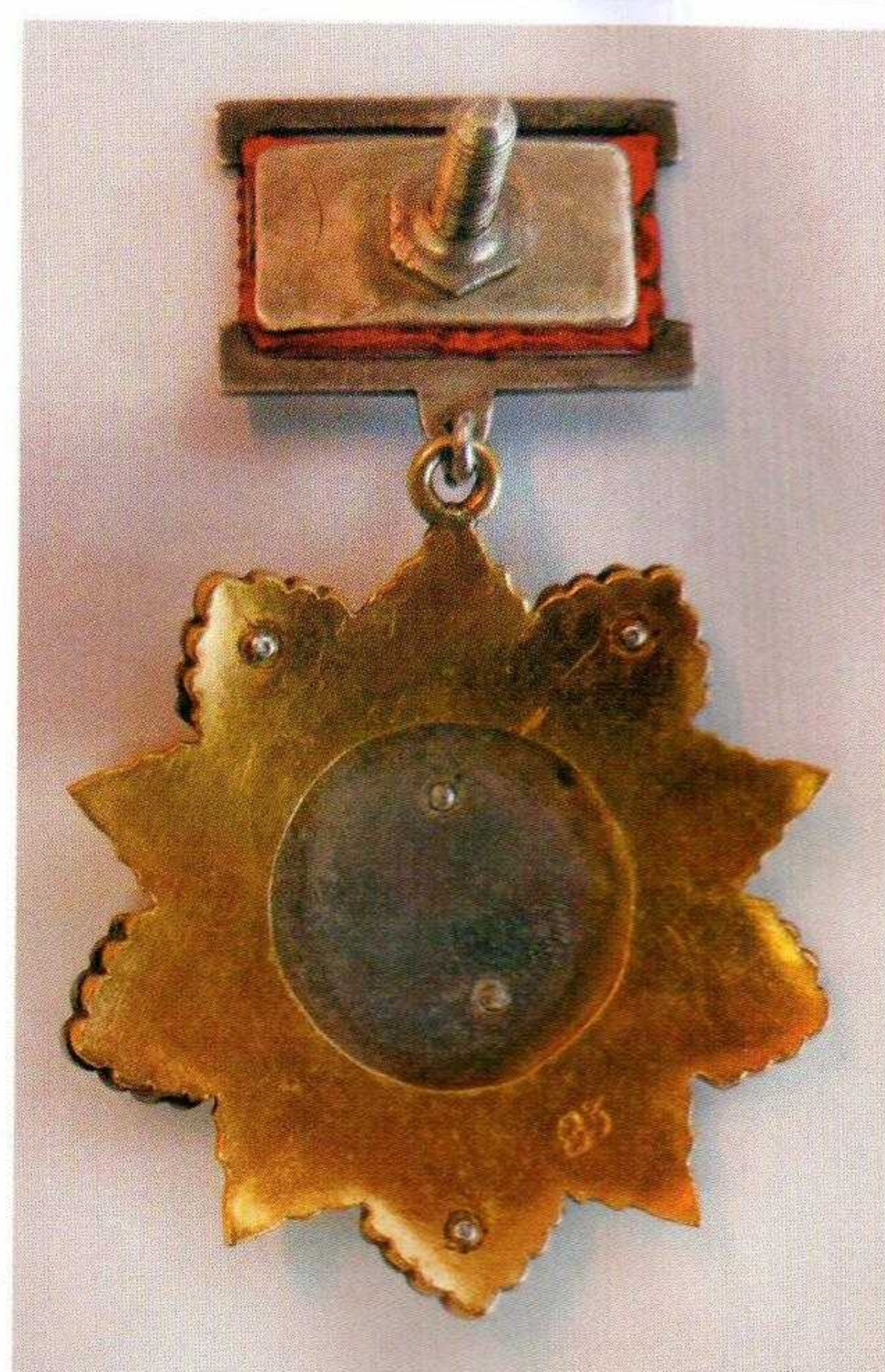
▲ Орден Кутузова №83, II степени (лицевая и оборотная стороны) образца 1942 года – из коллекции Государственного исторического музея