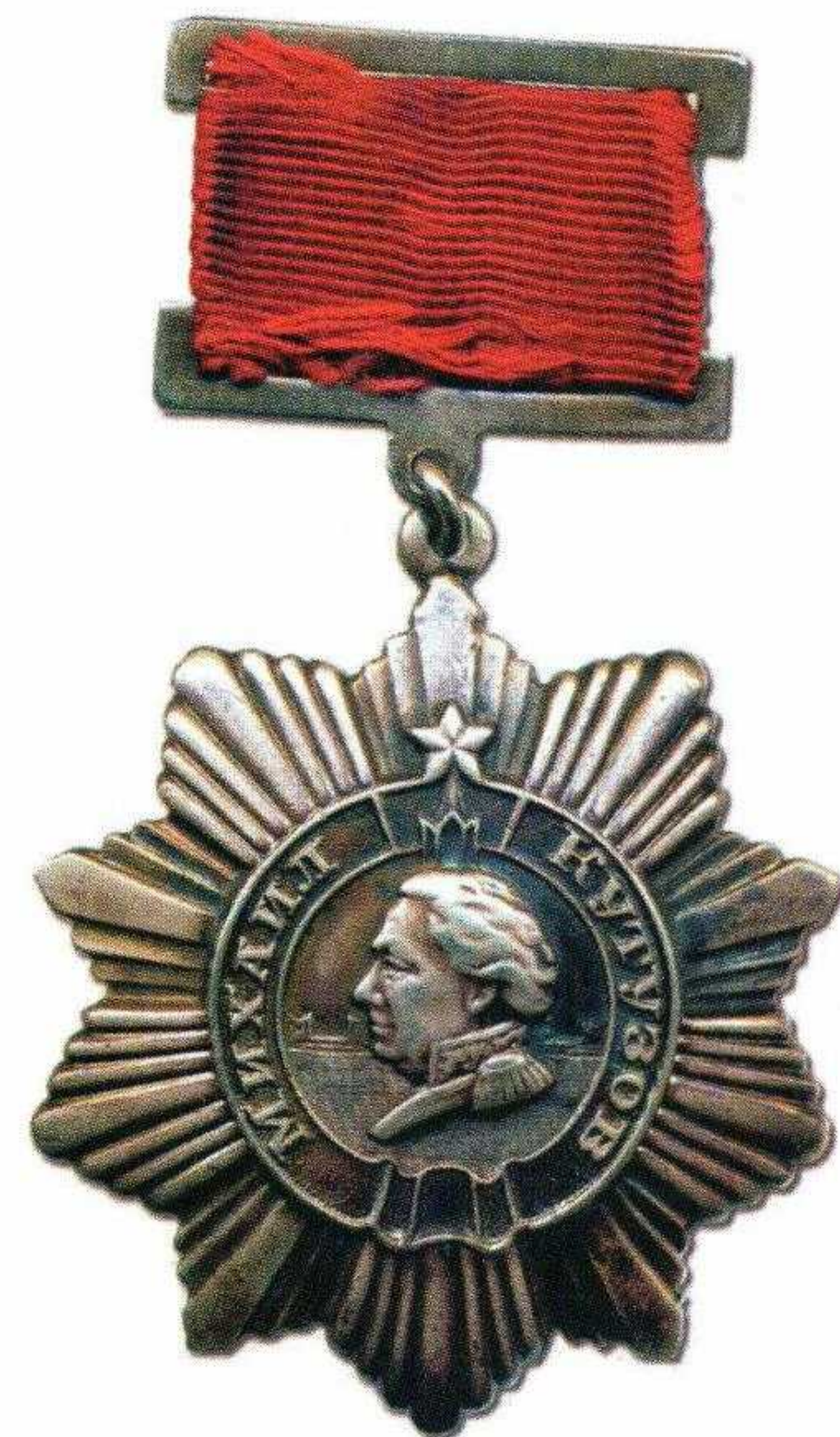
▲ Орден Кутузова III степени образца 1943 г.