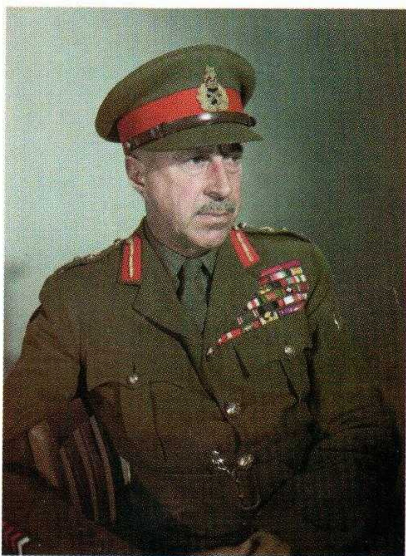
▲ Хенри Данкан Грэхэм Крирар – канадский генерал, ведущий руководитель вооруженных сил Канады во Второй мировой войне

Дважды награждались полководческим орденом Кутузова промышленные предприятия – в 1945 году Челябинский тракторный завод им. Ленина, а также Кузнецкий металлургический комбинат (четырежды орденосный) – за значительный вклад танкостроителей и металлургов в разгром фашистской Германии.