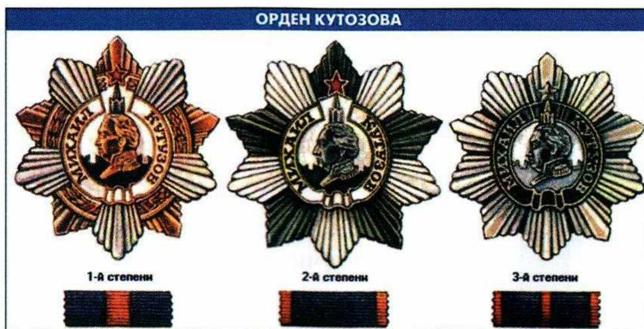
◀ Три степени ордена Кутузова и орденские планки к ним