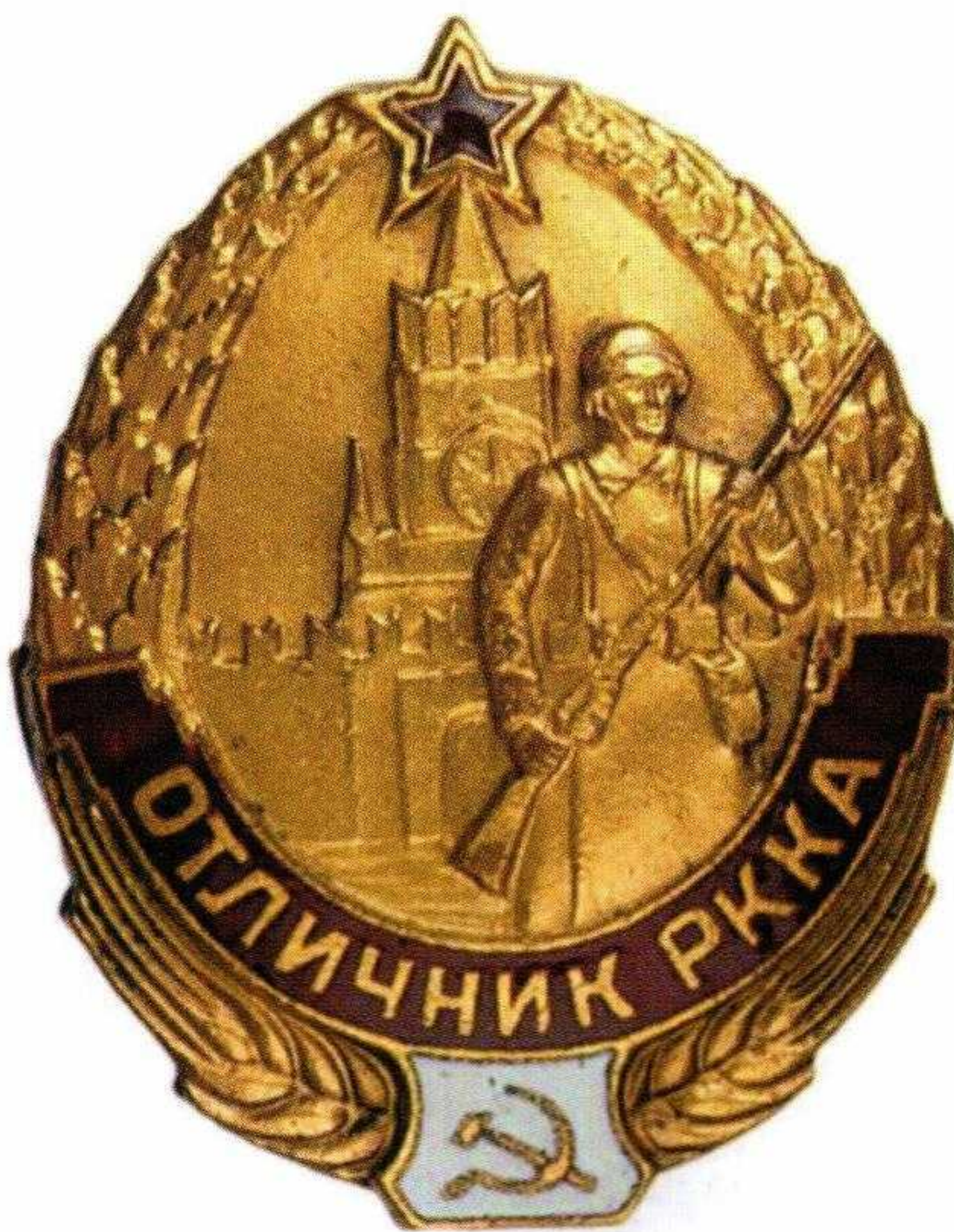
▲ Знак «Отличник РККА»