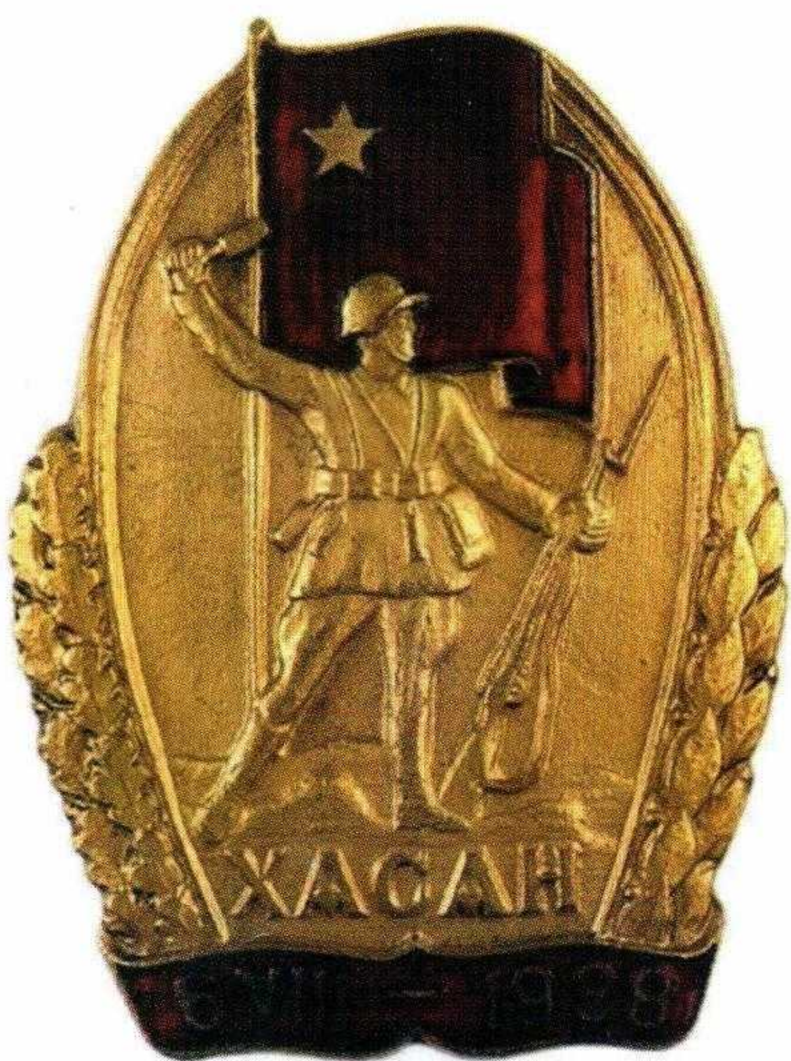
▲ Знак «Участнику боев на озере Хасан»