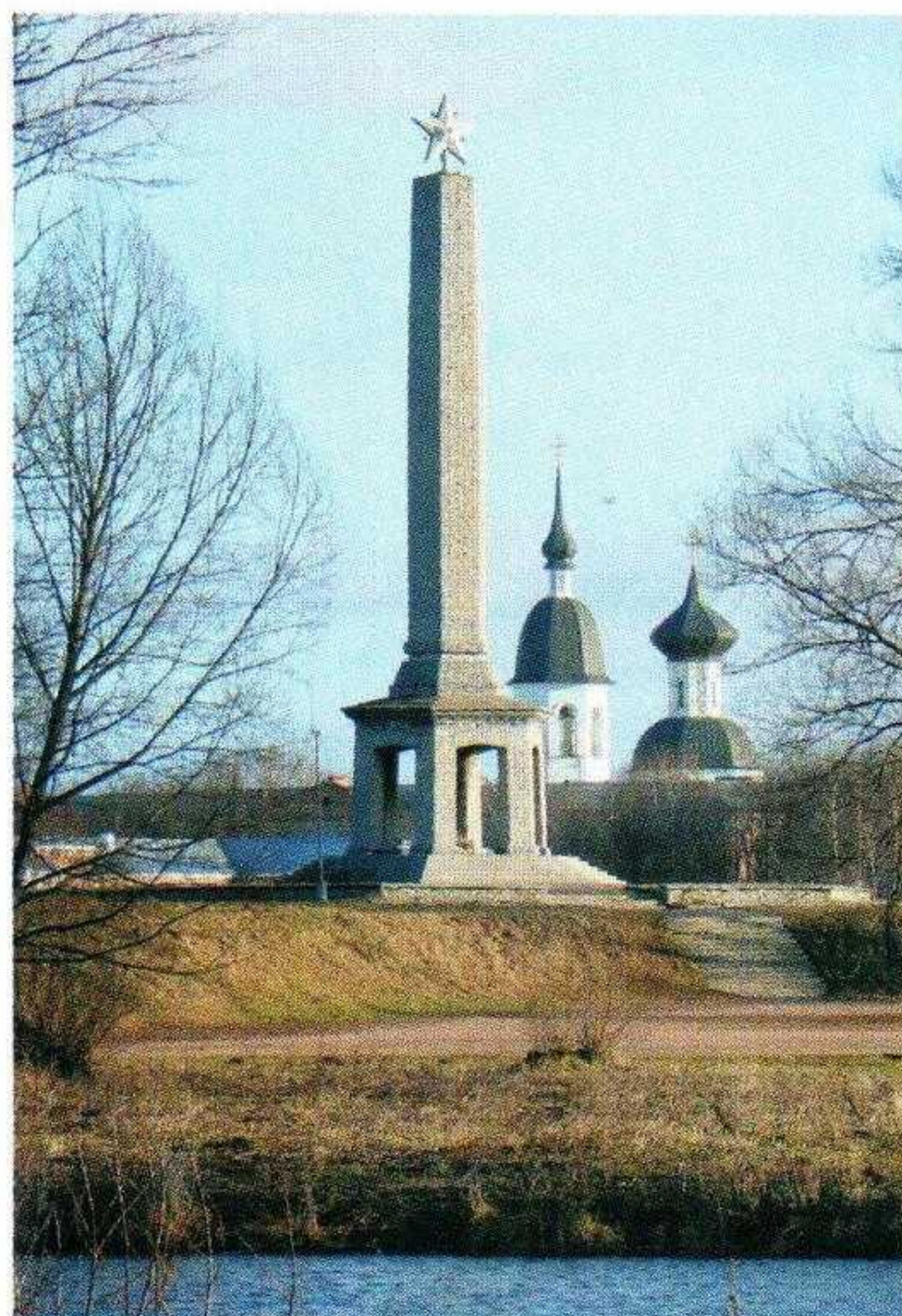
◀ Стелла в память погибших во время штурма Великих Лук

Тремя орденами Кутузова I степени были награждены пять человек: Маршал Советского Союза В. Д. Соколовский (он же был кавалером трех орденов Суворова I степени), генерал-полковник К. А. Коротеев, генерал-полковник Т. Ф. Штыков, генерал-полковник авиации А. В. Никитин, генерал-майор А. В. Владимирский. Двумя орденами Кутузова I степени награждены Маршалы Советского Союза А. А. Гречко, М. В. Захаров, И. С. Конев, К. С. Москаленко, генералы армии Д. Д. Лелюшенко, М. С. Малинин, М. М. Попов, Колпакчи В. Я., И. И. Федюнинский, генерал-полковники Желтов А. С., Галанин И. В. и другие.