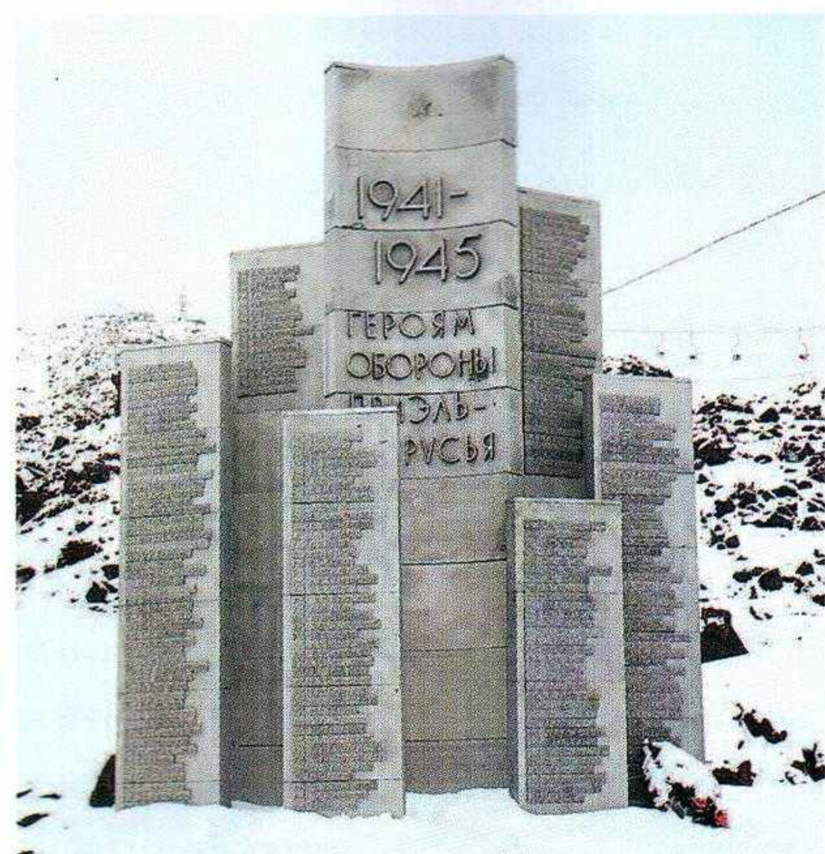
▲ Мемориал на Эльбрусе – на камне высечены имена тех солдат, которые ценой своих жизней остановили немцев на склонах высочайшей вершины Европы

Полководческий талант стратега-«оборонца» раскрылся у Тюленева после назначения его в феврале 1942 года командующим Закавказским фронтом. Тюленев переформировал оборонительные рубежи, усилив заслон со стороны Турции (до этого считалось, что южный сосед не станет входить в коалицию с Гитлером и нападать на СССР), создал рубежи обороны в районе реки Терек и Грозного, была усилена оборона Главного Кавказского хребта. События лета 1942 года, когда немцы рванулись к нефтяным промыслам Грозного и Баку, подтвердили верность решения командующего. Оборона, выстроенная под руководством Тюленева, выстояла. А в январе 1943 года Закавказский фронт начал наступление на Краснодар и Новороссийск. Именно за Кавказ Тюленев и получил своего «Кутузова» I степени.