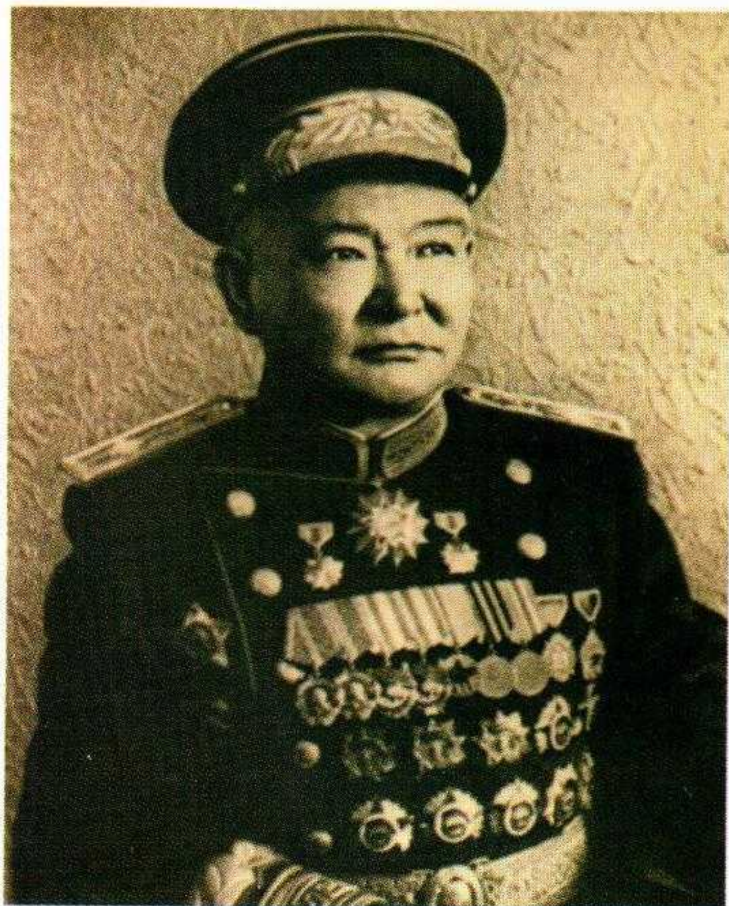
▲ Хорлоогийн Чойбалсан – политический лидер Монголии с 1930-х годов до своей смерти. Маршал. При жизни Чойбалсана и некоторое время после его смерти в Монголии существовал культ его личности, подобный культу личности Сталина в СССР