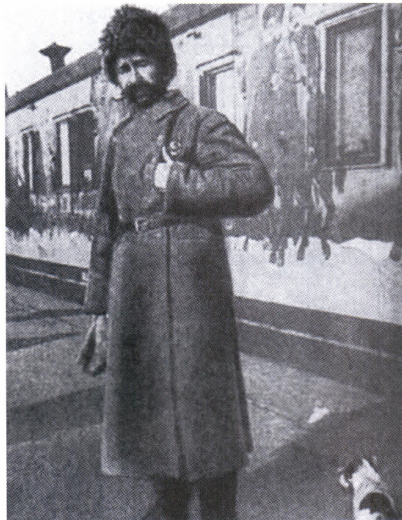
▲ После убийства Мирона осталось крайне мало фотографий, на которых он запечатлен с орденом Красной Звезды №3. Оно и понятно: ведь его награда перешла Вождю и память о прежнем обладателе ордена тщательно «зачистили»

Мирон (так его называли казаки) был донским есаулом и, по сути, «народным царем» времен Гражданской войны. Именно он возглавил Вторую конную армию (первой командовал Буденный) и воевал так успешно, что атаман Войска Донского назначил за его голову баснословную награду - 500 тысяч рублей. Но как только на Дону начался красный террор, Мирон открыто выступил против Советской власти, был отстранен от формирования красноармейских частей из казаков и стал кем-то вроде современных правозащитников, пытаясь всеми правдами и неправдами спасти казаков от репрессий. В конце концов терпение Ленина лопнуло, и в начале 1921 года Мирон был арестован как предатель интересов большевиков. Второго апреля 1921 года при странных обстоятельствах Мирон был «случайно» застрелен конвоиром во дворе Бутырской тюрьмы.