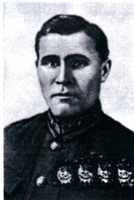
▲ Декретом ВЦИК от 8 апреля 1920 года было введено и Почетное революционное оружие — шашка или кортик с вызолоченным эфесом и знаком ордена Красного Знамени на нем. Такой награды удостоивали лиц высшего командного состава Красной Армии за особые боевые отличия. Последним по времени Почетным революционным оружием был отмечен «за отличия при ликвидации конфликта на Китайско-Восточной железной дороге в 1929 году»