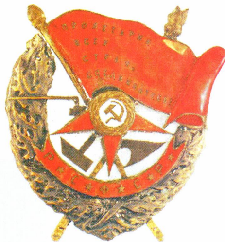
▲ Вариант ордена Красного Знамени работы братьев Бовдзей

Советская наградная система изначально не была запланирована и возникла лишь как требование времени. Но именно ордена и медали СССР стали (и до сих пор остаются) символом мужественности, самоотверженности и патриотизма советского народа, прошедшего через множество испытаний и победившего всех своих врагов.