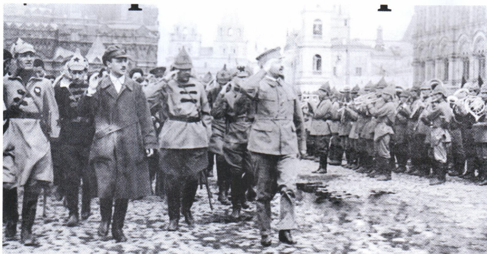
▲ Наркомвоенмор Лев Троцкий принимает парад войск на Красной площади. Слева на фото – офицер с одним из первых орденов Красного Знамени на груди (награда крепилась на красный бант-«розетку»)

Сначала это были золотые часы, портсигары, кольца с бриллиантами – все, что отбиралось у «буржуев». В ход шли даже пресловутые «красные революционные шаровары». То есть все то, что в эпоху всеобщей нужды можно было продать, обменять на хлеб или, банально, одеть на себя. Но с такими «наградами» армия рисковала быстро превратиться в барахолку, набранную из мародеров. Нужна была по-настоящему военная награда.