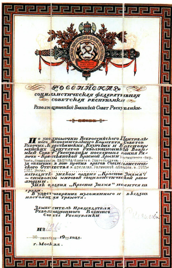
▲ Грамота к ордену Красного Знамени 1923 г