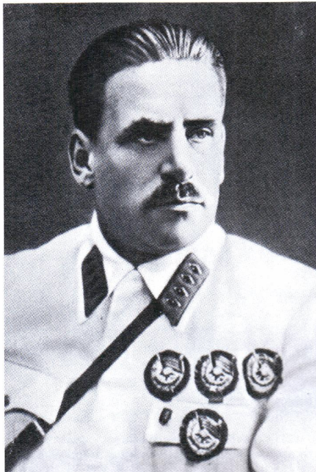
► Василий Константинович Блюхер оставался живой легендой и идеалом для каждого красного командира – вплоть до 1938 г