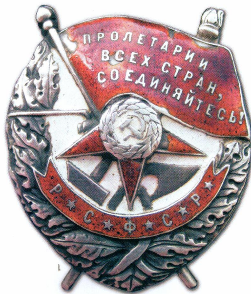
▲ Орден Красного Знамени РСФСР и после 1932 года долгое время вручался, как боевая награда СССР – так и значилось в документах...

Орден Красного Знамени не имел степеней, но «нумеровался» в том случае, если его обладатель уже имел аналогичные награды. Так, например, орден с цифрой «5»