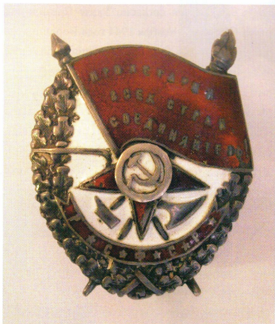
▲ Орден КЗ РСФСР № 25077, изготовленный в Тифлисе

Подвиг гражданского ледокола, приравненный к боевому, состоял в том, что «Сибиряков» впервые в истории прошёл Северным морским путём в одну навигацию. Моряков ледокола не остановили невероятные трудности — борясь с 4–5-метровыми льдами, он несколько раз ломал лопасти винта, а за две недели до окончания похода обломился конец гребного вала, и остаток пути «Сибирякову» пришлось идти под импровизированными парусами, сшитыми из брезента. Северный морской путь был преодолен за два месяца и пять дней, с 28 июля по 1 октября 1932 года. Но орденосному ледоколу пришлось совершить ещё один, последний подвиг. 25 августа 1942 года, в самый разгар Великой Отечественной войны, в Карском море «Сибиряков» встретился с тяжёлым немецким крейсером «Адмирал Шпеер». Против четырёх орудий старого ледокола — двадцать восемь орудий и восемь торпедных аппаратов фашистского рейдера! Но экипаж «Сибирякова» во главе с капитаном Анатолием Алексеевичем Качарова принял неравный бой, успев до героической гибели послать в эфир радиосообщение о появлении в советской Арктике германского крейсера. Последним покинул тонущий ледокол его капитан, который за этот подвиг был награждён боевым орденом Красного Знамени, как десятью годами ранее — «Сибиряков».