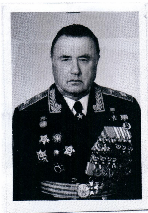
► Единственным человеком, который награжден орденом Красного Знамени восемь раз, стал летчик-штурмовик, маршал авиации, Герой Советского Союза Иван Иванович Пстыго