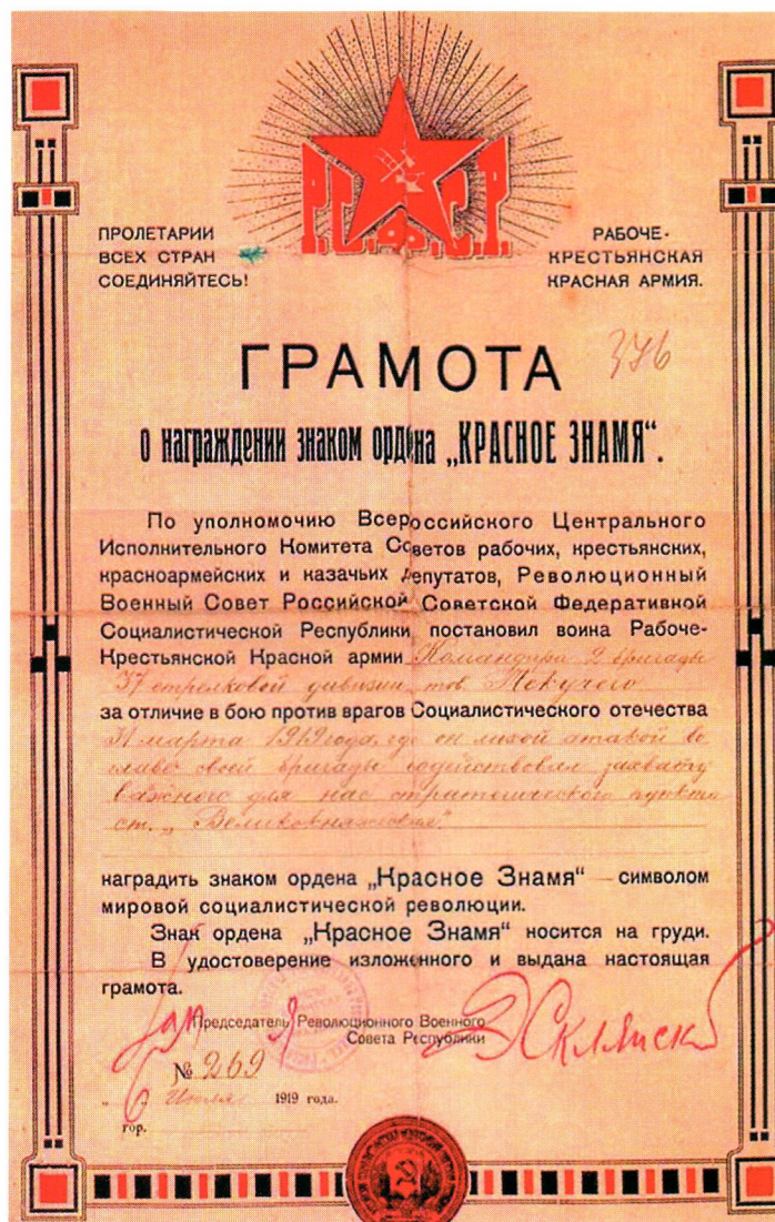
▲ Грамота к ордену Красного Знамени 1919 г

Орден при помощи ушка и кольца соединен с пятиугольной колодкой, покрытой шелковой муаровой лентой шириной 24 мм. Посередине ленты продольная белая полоса шириной 8 мм, ближе к краям две красные полосы шириной 7 мм каждая и по краям две белые полосы по 1 мм. При ношении орденской ленты на планках без орденов планка ордена Красного Знамени располагается после планок ордена Ленина и ордена Октябрьской революции.