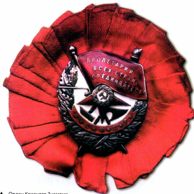
▲ Орден Красного Знамени РСФСР с бантом

Первым такой награды постановлением ВЦИК от 20 августа 1918 г. за бой под Казанью был удостоен 5-й Земгальский стрелковый полк – Троцкий хотел, чтобы трагичная судьба этого подразделения не дезорганизовала, а, напротив, сплотила его армию.