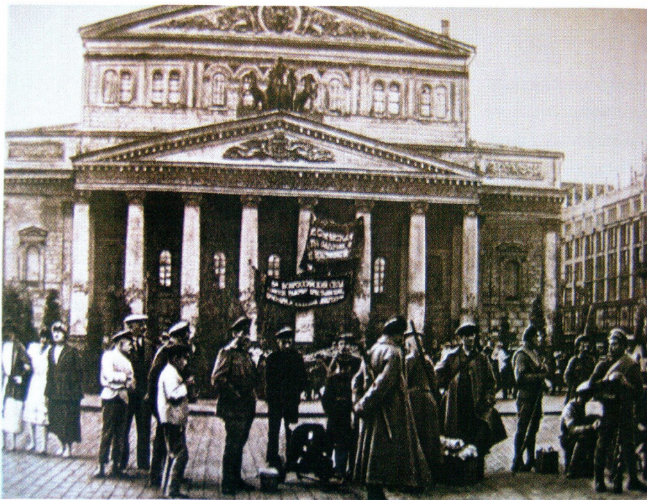
▲ Герои подавления левоэсеровского мятежа в Москве, латышские стрелки (на фото) потерпели поражение от Каппеля под Казанью. Зато заслужили наградное Красное Знамя от Троцкого