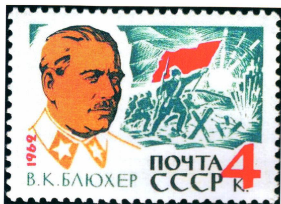
▲ Лишь спустя более 20 лет после смерти о Блюхере снова вспомнили – он стал появляться даже на советских марках

40-м, его родным сообщают, что Панюшкин приговорен к 8 годам тюрьмы как немецкий шпион. В 1944-м, в разгар войны, ему, как «приспешнику врага», увеличивают срок до десяти лет. Василий Лукич отбывает тюремный срок полностью (!), не попав ни под одну из амнистий – даже хрущевскую. Он выходит из тюрьмы дряхлым стариком, -молчаливым, замкнутым, больным. Спустя всего несколько лет кавалер ордена «Красная Звезда» №2 умирает.