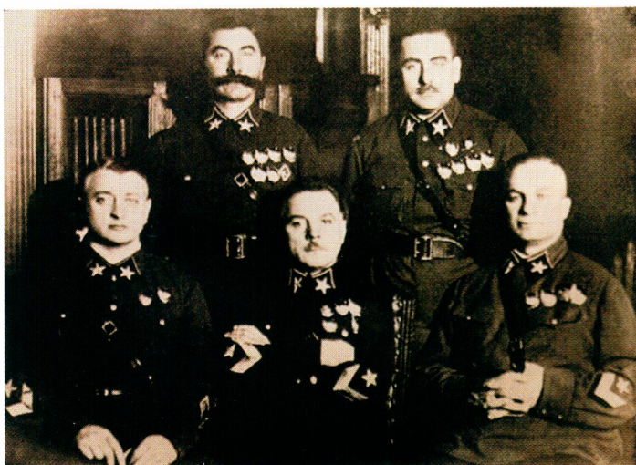
▲ Первые пять маршалов – кавалеров ордена Красного Знамени (слева направо): Тухачевский, Ворошилов, Егоров (сидят), Будённый и Блюхер (стоят)

орденов СССР и числа награжденных ввели ношение планок с лентами взамен орденов. Таким образом, ордена Красного Знамени после 19 июня 1943 года приобрели в верхней части знака ордена ушко, в которое продевалось кольцо, соединяемое с пятиугольной колодочкой. Штифт с реверса, естественно, исчез (Тип 3 и Тип 4). Собственно знак ордена Красного Знамени всегда был цельноштампованным, без накладных деталей.