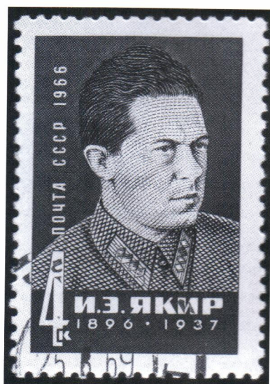
◀ Символ реабилитации – портрет на марках – появился у Ионы Якира на четыре года позднее, чем у Блюхера – только в 1966-м.

Примечательно, что за несколько месяцев до Панюшкина, в апреле 1937 года, был арестован и вскоре расстрелян командарм 1-го ранга Иона Якир. Для нас он интересен не тем, что на пленуме ЦК ВКП(б) в феврале-марте 1937-го именно Якир потребовал суда и расстрела для Бухарина и Рыкова. И даже не тем, что в Гражданскую войну Якир стал автором приказа о «процентном» истреблении всего мужского населения Кубани и Дона, означавшим фактически геноцид казачества. Дело в том, что Якир, также, как и Панюшкин, – ...кавалер ордена «Красное знамя» №2! Бойцы отряда Якира, зная о новой награде, но не понимая, когда же она появится в войсках (Троцкий как раз перебирал новые и новые варианты, присылаемые с Петроградского монетного двора), решили не ждать и заказали орден для своего командира местному ювелиру. Конечно, официального номера орден не имел и официально не признан.