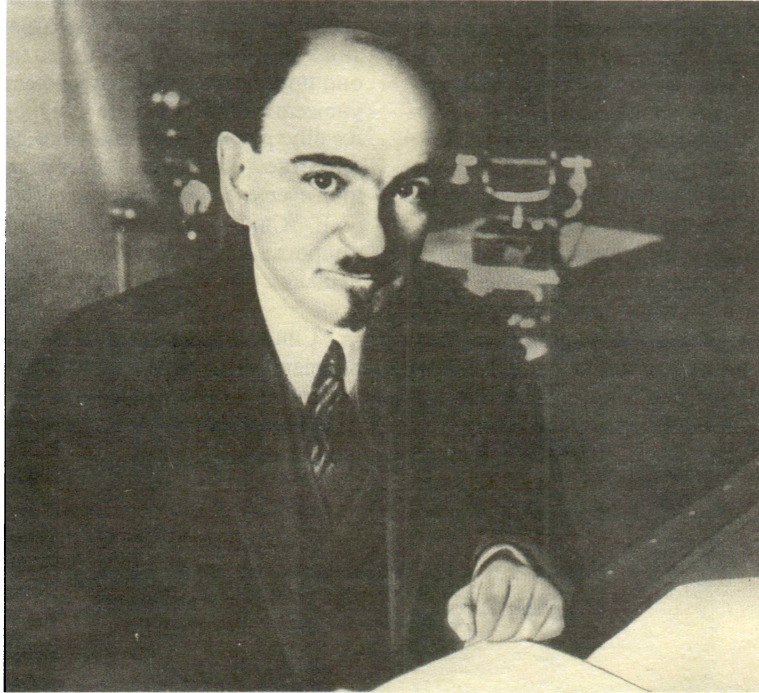
Борис Спиридонович СТОМОНЯКОВ (1882 – 1941)

Борис Спиридонович Стомоняков – профессиональный революционер, член РСДРП с 1902 года, видный советский дипломат. По национальности – болгарин.