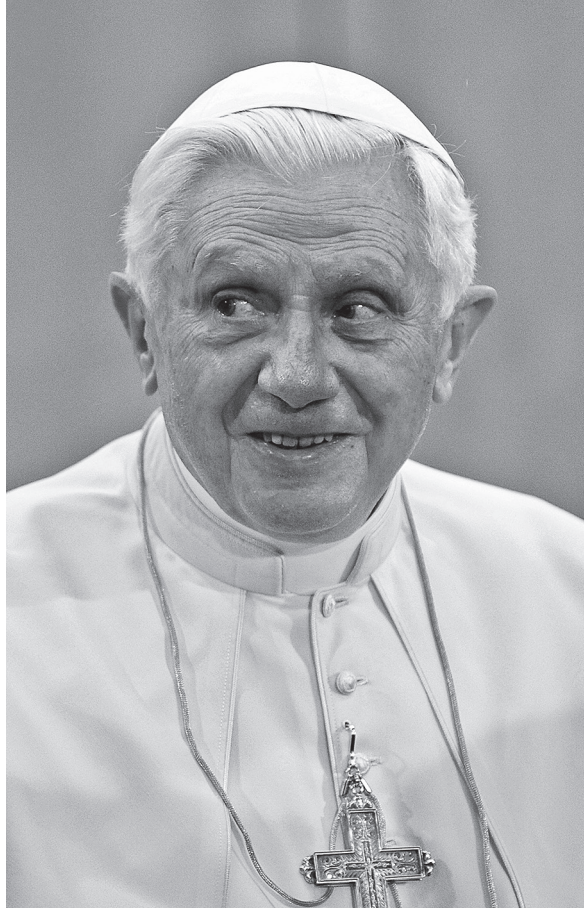
Бенедикт XVI: не всякого Папу выбрал Святой Дух

нас не покидая. Таким образом, роль Духа следует понимать намного более гибко, он не тот, кто называет кандидата, за которого следует голосовать. Вероятно, единственная гарантия, какую он дает, что в итоге все не будет полностью разрушено. Есть слишком много примеров Римских Пап, которых Святой Дух, разумеется, не выбрал бы» 2 .