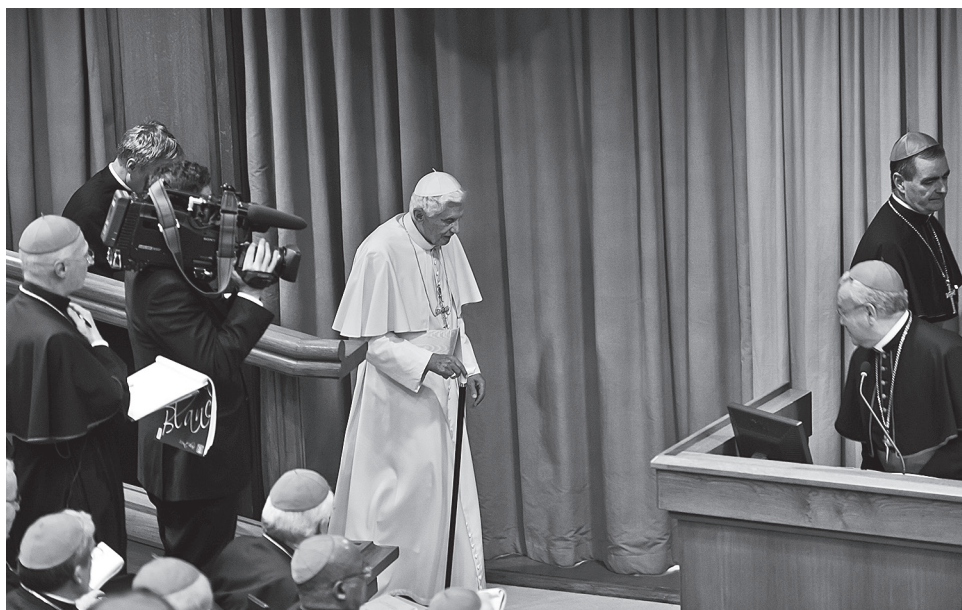
Папа с тростью в кулуарах Ватикана

сильнее, чем вчера. У самых дверей, распахнувшихся на гляцевитую сцену, личный секретарь монс. Георг Генсвайн по привычке наклоняется, чтобы забрать трость у него из рук, и вдруг Бенедикт XVI ее не отдает и проходит дальше. Так он впервые появляется на публике с палочкой, словно уже наполовину в образе пенсионера.