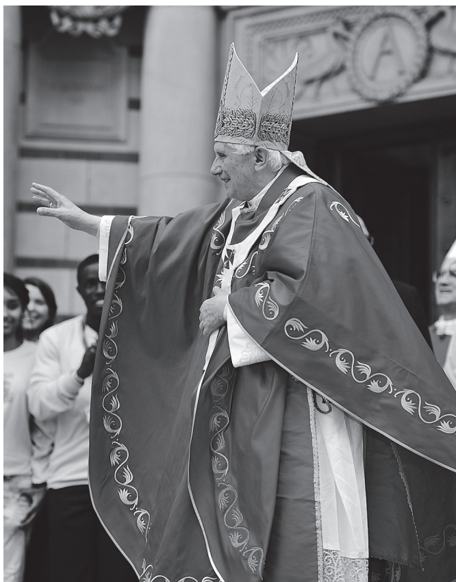
Действительно ли Вы последний? — Все возможно