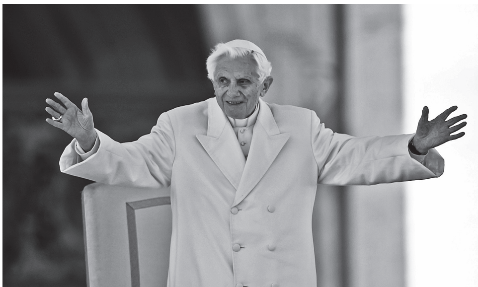
Папа обнимает всех на прощание, 27 февраля 2013 года

политическому] активизму. В Великий Пост мы учимся уделять должное время молитве, личной и общинной, которая как воздух для нашей духовной жизни. Кроме того, молитвой не закрываются от мира и его противоречий, чего так желает Петр на горе Фавор, напротив, молитва заставляет продолжать путь и действовать. «Христианская жизнь, — писал я в Послании на этот Великий Пост, — состоит в непрерывном восхождении на гору встречи с Богом, чтобы потом спуститься вниз, неся исходящие из нее любовь и силу в служении нашим братьям и сестрам с той же Божьей любовью» 7 .