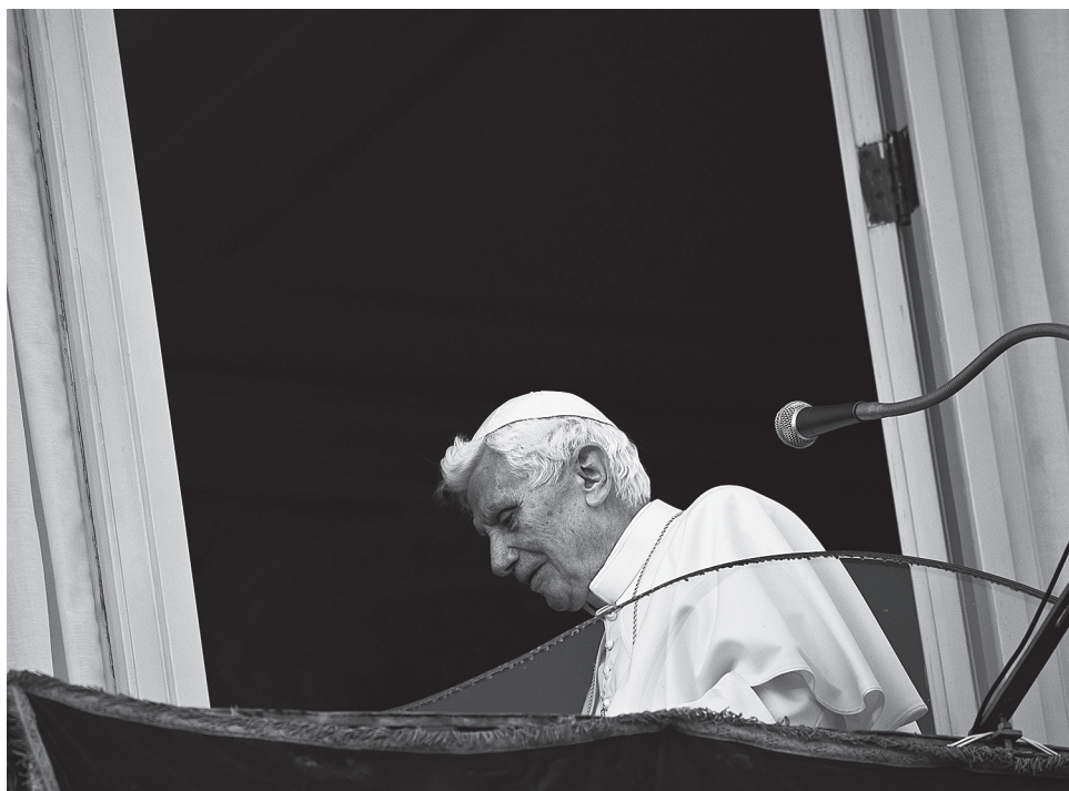
Папа уходит с балкона в Кастель Гандольфо, 28 февраля 2013 года

В беседе с биографом позднее он отметит, что когда «отец перестает выполнять роль отца», потому что дети уже стали большими, «он не перестает быть им, но утрачивает определенную ответственность. Он продолжает быть отцом в более глубоком, интимном смысле (in un senso più profondo, più intimo)». И далее проводит аналогию с папством: «если он отрекается, то сохраняет принятую на себя ответственность во внутреннем смысле, а не в исполнении должностных обязанностей (funzione)». Значит он, как отец, в миг расставания прибавляет: «Вместе пойдем вперед с Господом ради блага Церкви и мира». Эти слова вступают в резонанс с самой первой речью, сказанной после избрания с ложи ватиканской Базилики: «В радости воскресшего Господа, уповая на Его неизменную помощь, пойдем вперед». Раковина, которой паломник зачерпывает воду, она же — чаша.