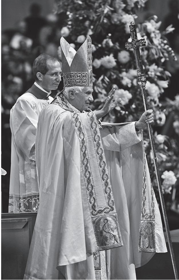
Торжественность для Папы — норма жизни

В качестве второго условия указывается «торжественность». Однако ни в документах Первого Ватиканского Собора, ни Второго, ни в иных связанных постановлениях Святейшего Отца нет такого требования, для безошибочности папского учительства. Более того, за 150 лет Церковь не удосужилась описать рекомую «торжественность» и ее формы. Как можно узнать, когда торжественности достаточно? Когда Папа говорит по-особому вычурно и пафосно? Или во время литургии? Может быть, он должен перечислить перед тем все титулы и подчеркнуть свою высшую власть в Церкви, как сделал Пий XII, провозглашая догмат о Вознесении Девы Марии? Теперь этот случай считают единственным в истории применением догмата о непогрешимости. Стоило создавать догмат, которым никто не будет пользоваться. Такая уничижительная трактовка вероучительной истины может быть продиктована только одним: нежеланием понимать глубоко мистической