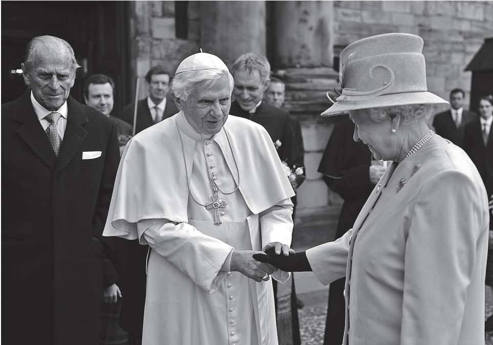
Бенедикт XVI на встрече с королевой Елизаветой II во время визита в Англию, 16 сентября 2010 года

о радушии было пока рано, потому что газеты вдоволь покуражились, беря комментарии у Докинза, на которые тот не скупился. Что позволило ему добавить к своей биографии несколько позорных страниц.