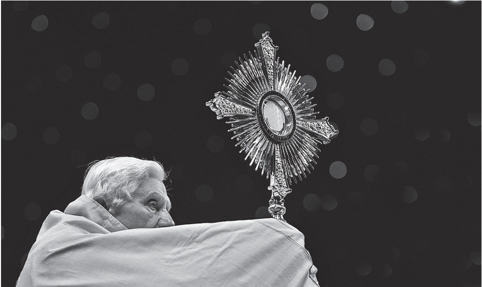
Папа призывает возобновить строгое благочестие

«Я уверен, что эта программа приведет к возрождению Церкви в Ирландии в полноте истины Божией, ибо именно истина делает нас свободными (ср. Ин 8, 32).