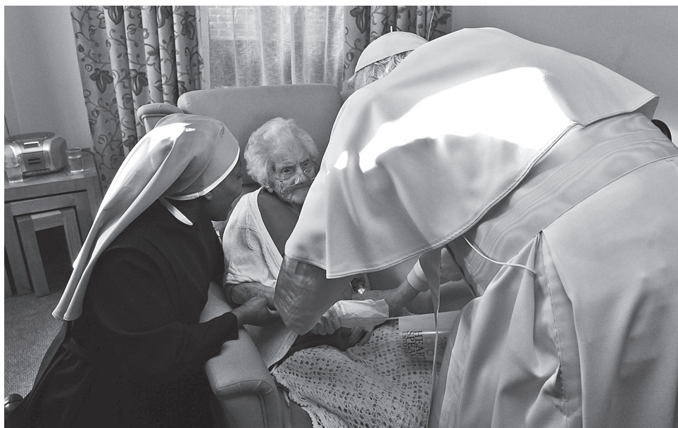
Бенедикт XVI беседует с обитателями дома престарелых

с речью, раскрывающей его отношение к проблеме старости и собственные ощущения по этому поводу. В частности, он сказал: