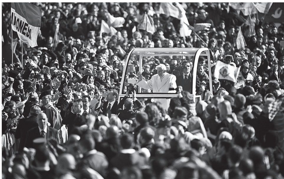
Бенедикт XVI в толпе паломников на последней общей аудиенции

а с другой — переживая, решать их, потому, что именно страдание есть путь преобразования, а без страдания ничего изменить нельзя 7 .