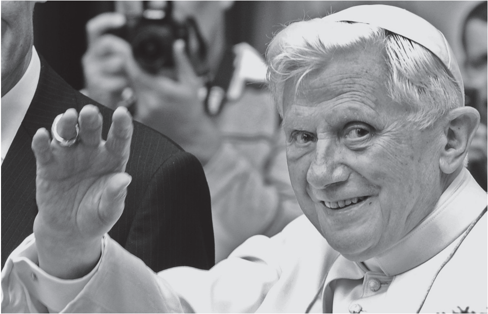
Папа ничего не видел левым глазом

трону, слегка ударялся о него бедром, нащупывал рукой подлокотник и только потом сел. В этот момент его лицо было обращено к публике. Тревожно было наблюдать, как он постоянно задевает об угол, а причина открылась только сейчас — он его не видел.