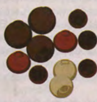
СМЕСЬ ПЕРЦЕВ ГОРОШКОМ