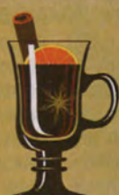
АПЕЛЬСИН ИЛИ МАНДАРИН