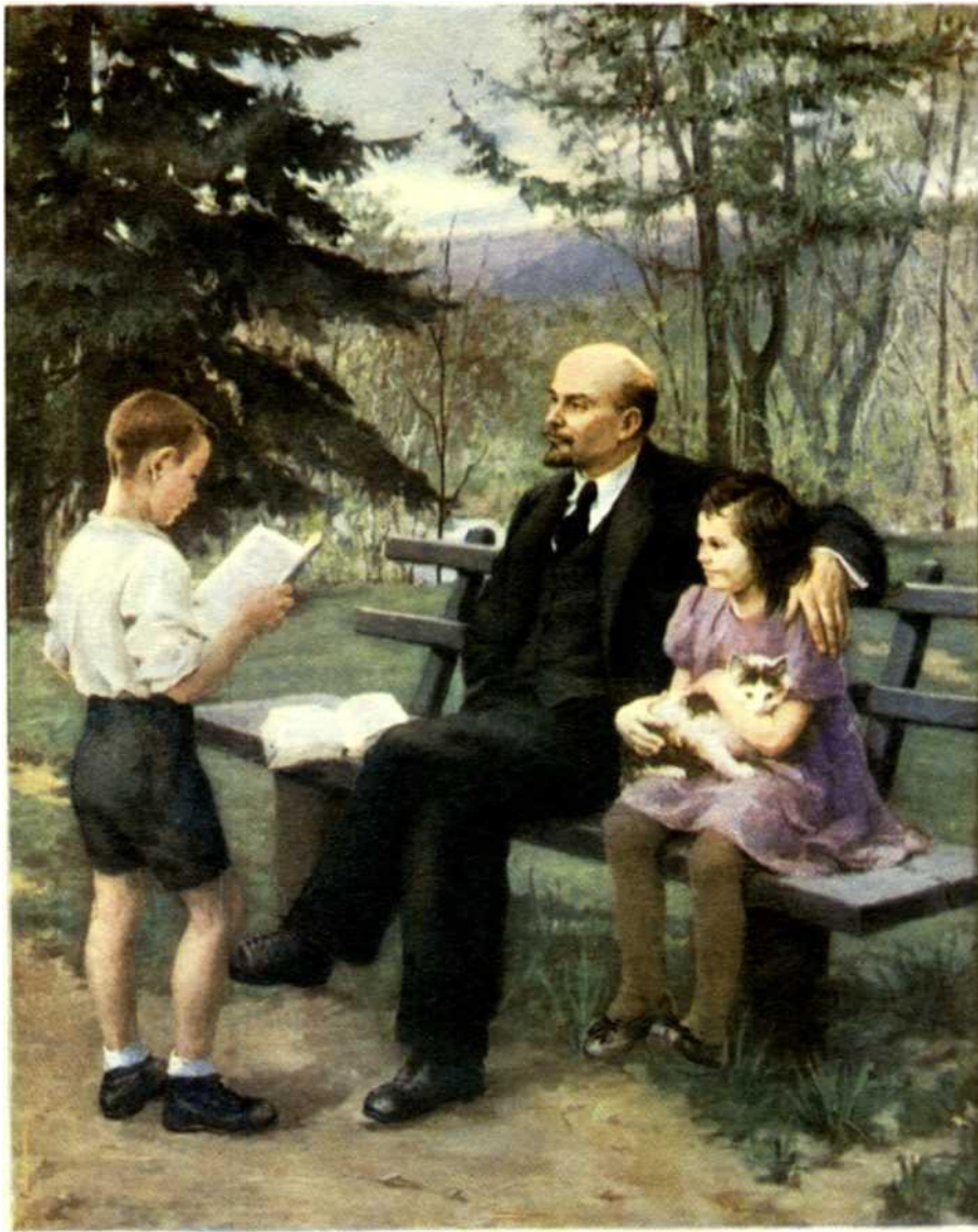
В. И. Ленин в Горках с детьми.